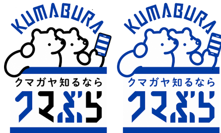
コピー入りタイプ