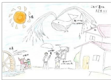
S F 部門「これで暑さも大丈夫!!!」