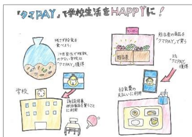
リアル部門「「クマPAY」で学校生活をHAPPYに！」

手書きやデジタルツールを使って描いた作品、WEB上で地図を加工できるサービスであるRe:Earth (リアース) などを使って描いた作品を募集します。