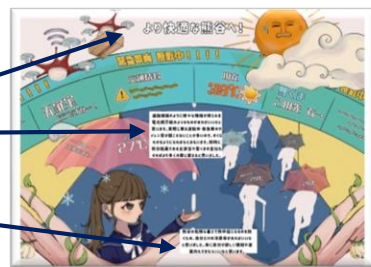
S F 部門「より快適な熊谷へ」