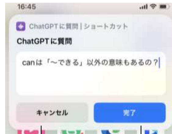
行動を取り消すボタン