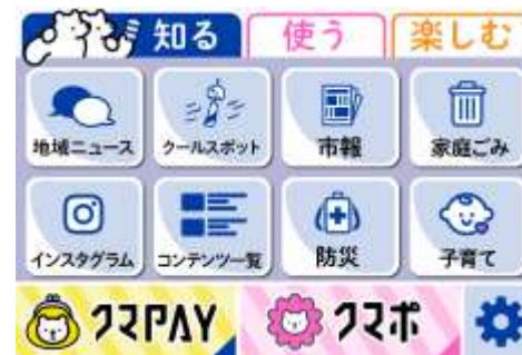
分かりやすいイラストと18px以下のテキスト例