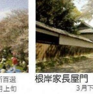
根岸家長屋門 さくら見頃は3月下旬～4月上旬