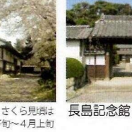
長島記念館 故長島恭助氏の生家