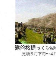
熊谷桜堤 さくら名所百選 見頃3月下旬～4月上旬