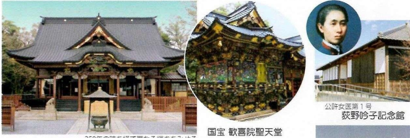
国宝 歡喜院聖天堂