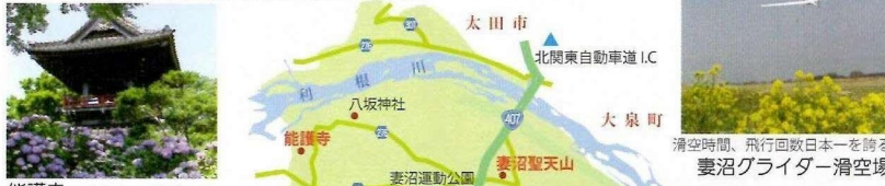
能護寺 あじさい 見頃6月