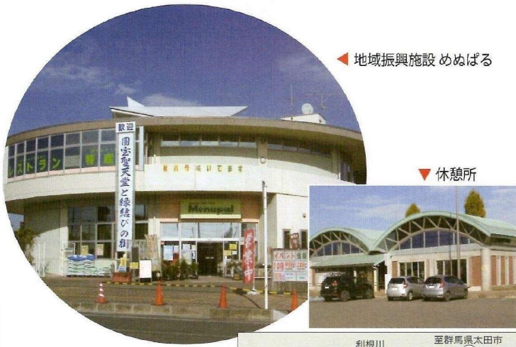
地域振興施設 めめばる