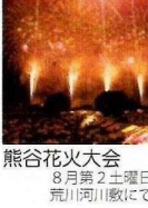
熊谷花火大会 8月第2土曜日 荒川河川敷にて