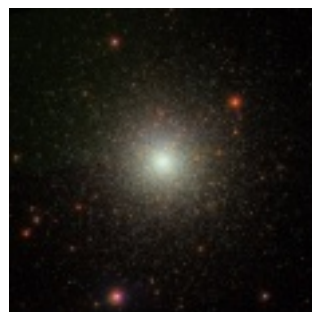
M3 〈りょうけん座の球状星団〉