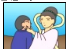
「天へ行ったラプー」 より