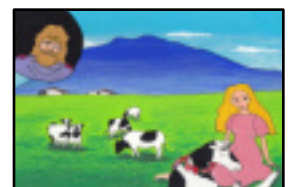
「海を渡る白牛」より