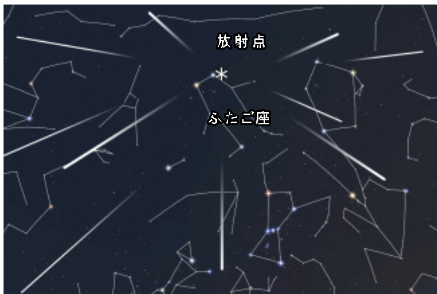
星図：ステラナビゲータ10/(株)アストロアーツ

12月15日に三大流星群の一つ、ふたご座流星群が極大(もっとも活発になる時)をむかえます。流星群とは、空のある一点(放射点)から放射状に流星が出現するように見える現象で、放射点のある星座の名前で呼ばれています。