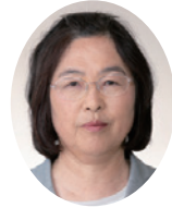
まくりい 桜井くるみ議員 (日本共産党)