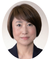
はやし りつこ 林幸子議員 (公明党)