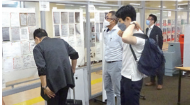
富山市「スケッチラボ」にて②