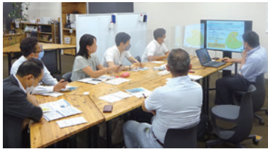
富山市「スケッチラボ」にて①

答 本年5月に、埼玉パナソニックワイルドナイツのレプリカユニフォームを返礼品として登録したところ、翌日に完売となり、人気を再確認したところである。引き続き関連グッズを返礼品として用意できるよう、チームと調整していきたいと考えている。(企画課)