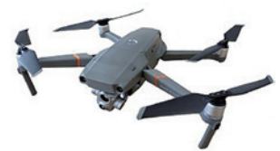
豊橋市ドローン飛行隊のドローン

心的な担い手として、市が育成を推進している認定農業者と認定新規就農者に対し、支援をしていく。