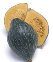
ラグビーカボチャの「ロロン」

答 熊谷青果市場の提案で令和2年から市場出荷が行われ、令和4年は17人の生産者が栽培に取り組んでいる。ラグビーカボチャは「ラグビータウン熊谷」との関連性があり、ブランド化の可能性を期待している。 (農業振興課)