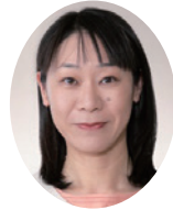
こしづかなほこ 腰塚菜穂子議員 (会派に属さない議員)