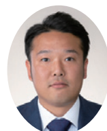
しらねよしのり 白根佳典議員 (日本共産党)