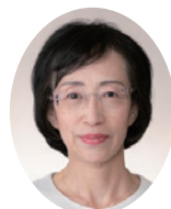
せきぐちちやゆい 関口弥生議員 (公明党)