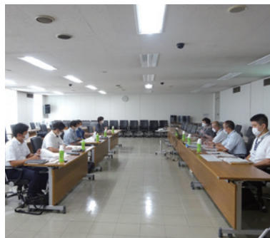
8/1 上尾市の視察の様子

■9月26日 山形県天童市議会 清新会 シティプロモーション および移住定住の促進について