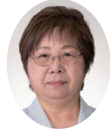
おおやまみちこ 大山美智子議員 (日本共産党)