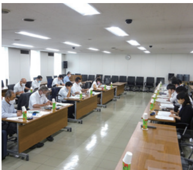
9/26 天童市の視察の様子

■9月26日 山形県天童市議会 清新会 シティプロモーション および移住定住の促進について