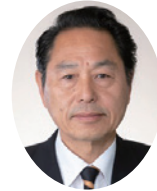
みうらかずいち 三浦和一議員 (公明党)