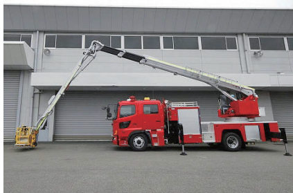
玉井分署に配備予定の屈折型はしご付消防自動車