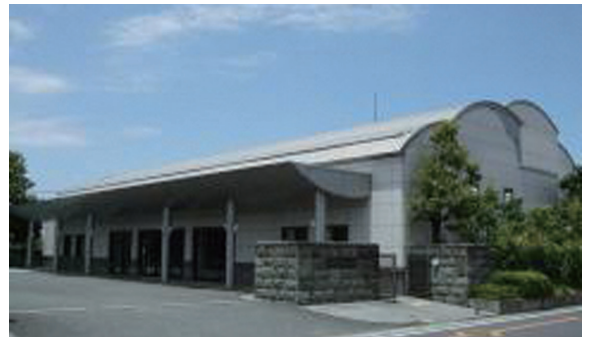
熊谷市立葬斎施設 (メモリアル彩雲)

問 修繕工事等への対応について、指定管理者が対応することとなる金額等の基準は定められているのか伺いたい。 答 大規模な修繕については市が、小規模な修繕については指定管理者が委託料の範囲内で対応することになるが、具体的な金額等については、今後示していくこととなる。 (葬斎施設)