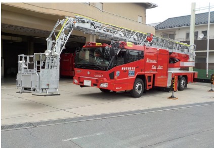
玉井分署から中央消防署へ配置替えとなる先端屈折式はしご付消防自動車