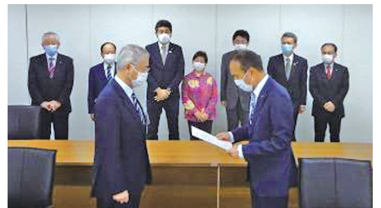
野澤議長(当時)から市長に対して要望書を提出。写真後列は各会派の代表議員