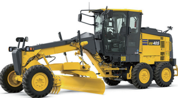
取得する財産と同型のモーターグレーダ

34・1%、家電関連が10・9%、自動車関連が4・5%、飲食店が2・3%であり、今後も新たな店舗登録の推進を図っていく。