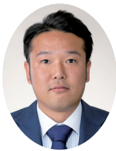
しらね よしのり 議員 会派:日本共産党