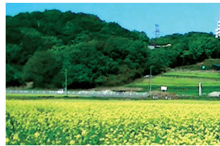
整備された菜の花農地(小江川)

答 100%熊谷産の菜種油の特産化を目指す組織が昨年7月に結成されたところであり、この事業を通じて、生産者・加工业者への支援、製品の流通の確立等を行い、農業の6次産業化につなげていく。(農業振興課)