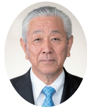
須永宣延議員 会派:熊谷清風会