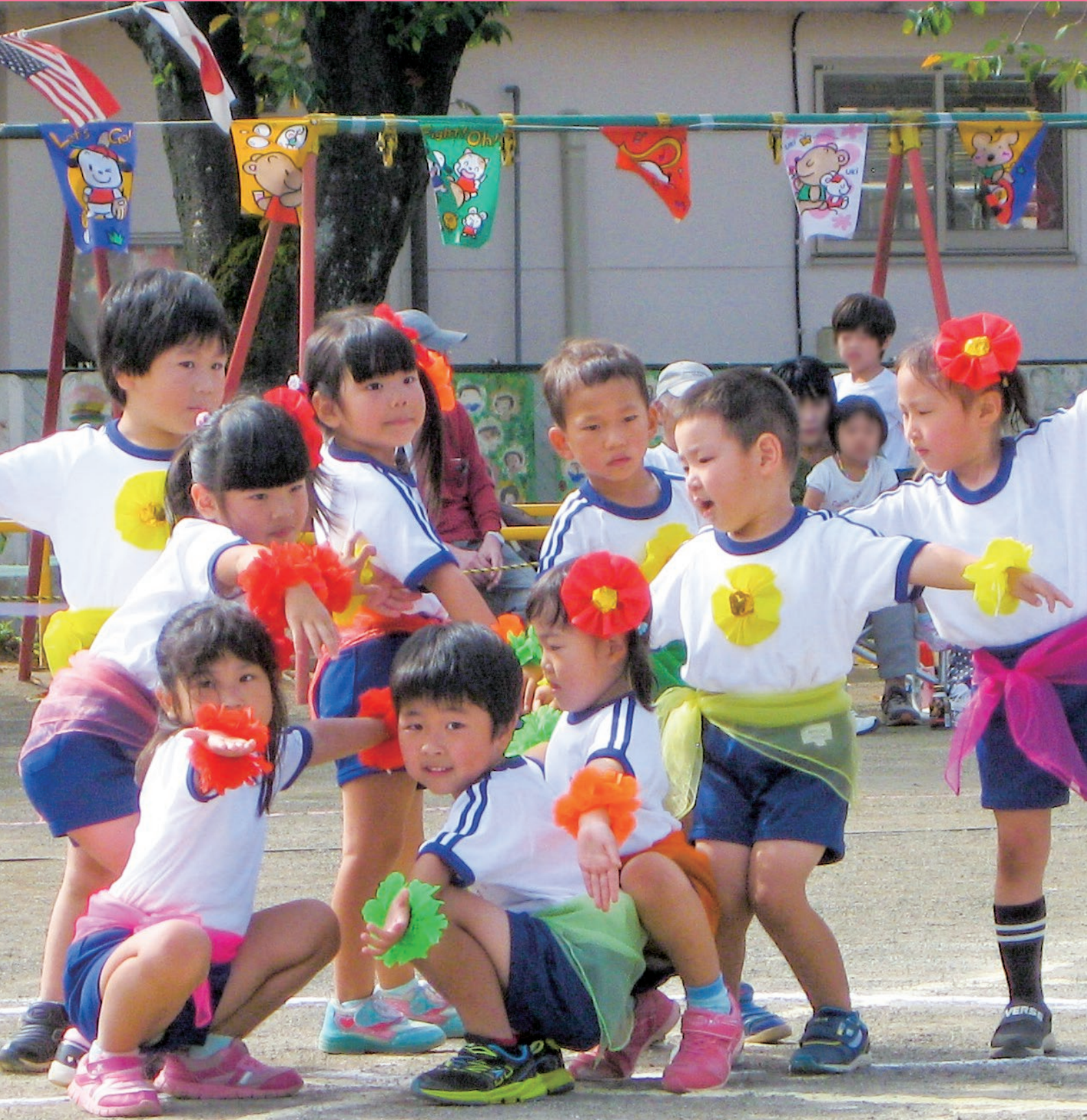
熊谷市立江南幼稚園運動会