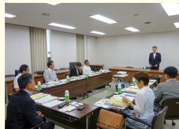
7/2 佐賀県小城市議会 総務常任委員会…「ゆうゆうバス」運営事業について