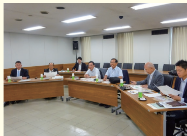
7/17 香川県観音寺市議会 文教民生委員会…学力向上対策推進事業について