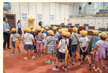
議会についての説明を聞く熊谷西小学校の児童

9月27日に、熊谷西小学校の2年生が生活科の授業の一環で議場を訪れ、議会について説明を受けました。