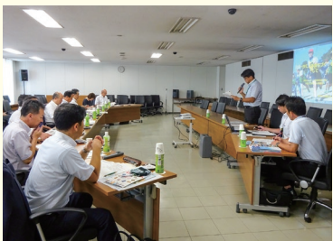
8/1 愛知県豊田市議会 教育社会委員会…スポーツ振興について