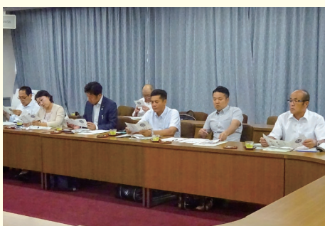
8/20 豊橋市での視察の様子

農業の持続的な発展のための、先端技術に長じた農業人材の育成や次世代農業を担う人材の確保のため、市内の国立大学法人と連携した各種講座、地域農業関連企業と連携しているとのこと、講座修了生の地元定着やインターンシップ受け入れ企業の拡大などが課題とのことでした。