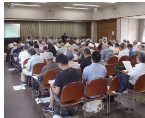
公共施設再編方針案のエリア別市民説明会の様子

答 今後、保護者や未就学児の親を対象とした意見交換会を開催し、いただいた意見を踏まえ、改めて地域説明会を開催するほか、子育て拠点施設や市政宅配講座等で説明していく。