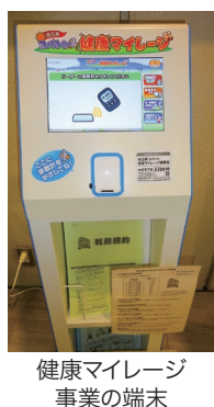
健康マイレージ事業の端末

答 令和元年7月末時点での申し込み受付者数は歩数計利用989人、スマートフォン利用384人である。（健康づくり課）