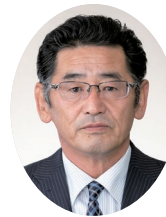
黒澤 三 夫 議員 会派：志桜会

問 終身雇用の崩壊、非正規雇用者の増加、ブラック企業、働き方改革など、労働環境は大きく変化しており、さまざまな立場の方の生活改善につながるよう、国、県、市が一体となった取り組み、民間事業者との連携等、適切な就労支援が不可欠であるが、本市の就労支援について伺う。