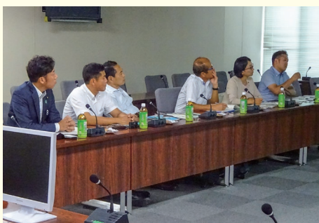
8/19 岡崎市での視察の様子

平成27年度に開始された本事業は、これまでの空き店舗対策としての補助金交付を止め、家守(やもり)社と呼ばれる民間のまちづくり会社が遊休不動産の所有者と不動産を活用して事業を行いたい者の間に入り、それを各種団体が支援し、不動産の賃貸借を成立させ、遊休不動産の活用によるまちづくり、にぎわい創出を進めるものとのことでした。