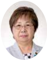
おおやま みちこ 大山美智子議員 会派:日本共産党