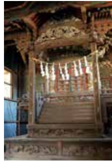
諏訪神社本殿 (上新田1032番地)

問 「STOPコロナ」小中学生検査キット配布事業について、この時期に実施することとした経緯を伺いたい。