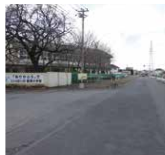
籠原小学校前の道路用地