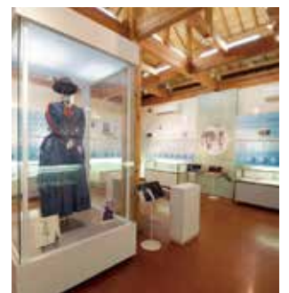
熊谷市立荻野吟子記念館 (俵瀬581番地1)

熊谷の歴史や文化を市民の皆様をはじめ、多くの方々に広く周知するとともに、文化遺産を観光資源と捉えて、まちの魅力として積極的に発信することで、本市への集客を促し、活力あるまちづくりにつなげていきたいと考えている。そのため、必要な施設については、公共施設再編方針による個別施設計画の中で、設置を検討していくこととなる。(社会教育課)