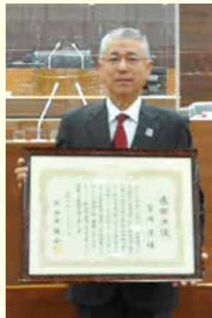
前市長の富岡 清様