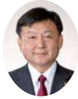
にいしまかずひで 新島一英議員 会派:令新クラブ