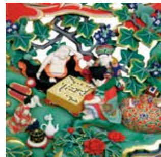
聖天山歓喜院の本殿にある囲碁の彫刻