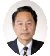
みづらかずいち 三浦和一議員 会派:公明党