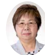
大山 美智子 議員 会派:日本共産党

東京オリ・パラ組織委員会、森前会長の女性差別発言による事態を、辞任で一件落着とさせるわけにはいかない。