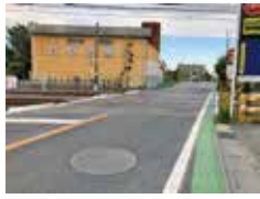
第二寄居街道踏切(石原地内)