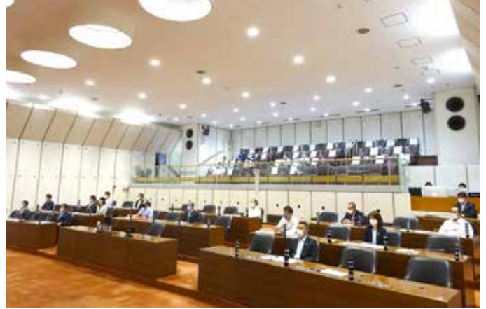
新型コロナウイルス感染対策として定足数を確保しながら議場内の人数の低減を行いました。