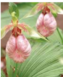
三ヶ尻の幸安寺境内等で見られるクマガイソウ

本市では直接的な保存活動は行っていないが、希少植物であることから、生育地として定着した場合には、新たな観光資源となる可能性があるものと考えている。