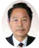
みうらかずいち 三浦和一議員 (公明党)