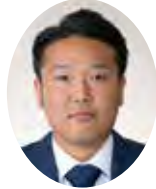
しらねのり 白根佳典議員 (日本共産党)