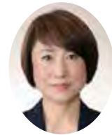
はやしさちこ 林幸子議員 (公明党)