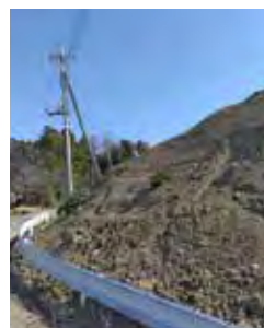
塩地内の堆積状況 【2022年3月12日撮影】

答 条例に基づく措置等の検討や県との合同視察を行っているが、今後さらなる連携強化が必要であると考えている。 (環境推進課)