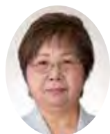
おおやま ちこ 大山美智子議員 (日本共産党)