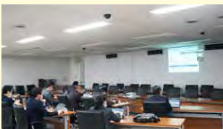
三条市とのオンライン行政視察の様子

また、自治会への出前講座・申請代行、市内商業施設での出張申請サポート、企業訪問による出張申請代行などのマイナンバーカードの普及活動についても説明を受けました。