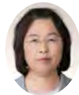
さくらい 桜井くるみ議員 (日本共産党)