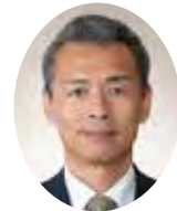
もりやあつし 守屋 淳 議員 (公明党)