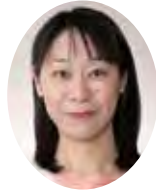
こしづかなほこ 腰塚菜穂子議員 (会派に属さない議員)