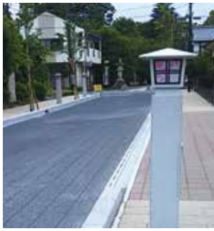
整備された市道妻沼1135号線

答 妻沼聖天山と歓喜院本坊を結ぶ市道妻沼1135号線の舗装面を石畳風に仕上げるなど、歴史情緒を感じられるまちづくりを進めている。今後は、県道太田熊谷線の妻沼小学校から坂田医院旧診療所までの区間において、埼玉県による歩道再整備が計画されており、本市としても良好な景観形成や快適な歩行空間づくりに取り組んでいく。