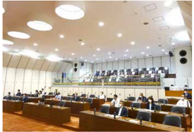
新型コロナウイルス感染対策として定足数を確保した上で議場内の人数の低減を行いました。