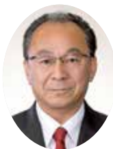
やましたかずお 山下一男議員 会派:令新クラブ