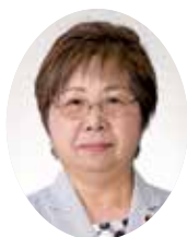
おおやま みちこ 大山美智子議員 会派：日本共産党