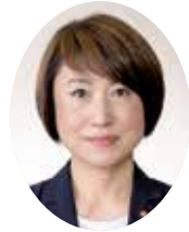
議員 林 幸子 党派: 公明党

問 公営住宅を取り巻く環境は時代とともに大きく変容し、近年では入居者資格の設定、入居者の収入と住宅の立地条件規模等に応じた家賃制度、また、民間事業者が保有する住宅の借り上げ・買い取り方式などが導入されるようになってきた。また、厳しい財政事情下で、公営住宅は全国的に社会問題化しているため、今後の住宅政策の在り方について問う。