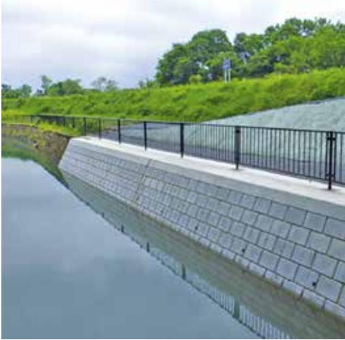
整備された沈砂池の護岸（深谷市菅沼地内）

答 令和元年台風第19号により被害を受けた深谷市菅沼地内の幹線水路の沈砂池における護岸復旧工事で、事業費は987万8000円、負担割合は国が66・8%、農業用水を使用する関係市が16・6%、土地改良区が16・6%である。なお、関係市の内訳としては、本市のほか、深谷市、行田市、鴻巣市があり、その受益面積割合により補助金の額を算出している。（農地整備課）