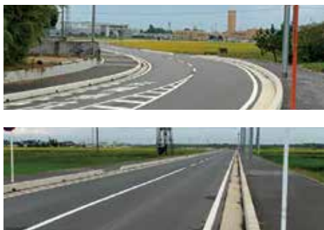
昨年供用開始した一部区間