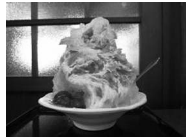
毎年新作も加わり、10周年となった雪くま

今回の補正予算は、県の補助金の内定に伴い、早急に対応が必要となった事業を計上した。