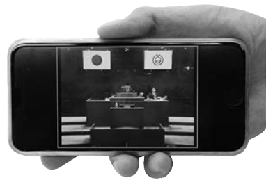
スマートフォンでの議会議中継

スマートフォンの議会議中継がご覧になれます! 平成28年6月議会から、議会議中継がスマートフォンでもご覧いただけるようになりました。より身近になつた議会議中継をぜひご利用ください。