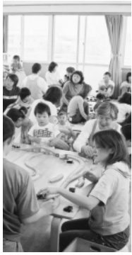
(所管課・母子健康センター)

答 これまでの5年間は積極的勧奨を差し控えていた。今年度は、第1期の対象者について積極的な勧奨の再開となったが、一度に接種することになるとワクチンの量が不足するため、3歳児を優先的に接種することとした。また、第1期初回接種の対象人数は、1回目が6,304人、2回目が6,608人の合計1万2,912人であり、個人負担については、3歳から7歳半までの間に接種すると市の補助で接種できることになる。また、1回の接種料については8,413円である。