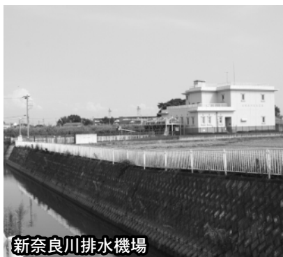
新奈良川排水機場

の水位に達した場合、排水機場のポンプ運転の制限や停止をしなければならぬ。これは放流先の一級河川へ内水排除を続けた場合には、一級河川の氾濫の危険性が非常に高まるため、やむを得ないと考えている。④地下室に通じる開口部などから水が入らないように、止水板を設置することについて、建物所有者自身に設置の必要性があるか否かの判断はしていただくことになっている。従って、止水板を設置させることについては、建築基準法に基づく指導の対象とすることはできない。⑤止水板設置のお願いをホームページに掲載するとともに、市の建築確認申請の窓口などにパンフレットを備え置くなどし、浸水被害対策の啓発を行っていきたい。 (下水道課)