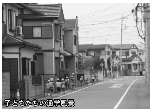
子どもたちの通学風景

「ホンダ寄居工場操業開始発表を受けた本市の対応について」 「熊谷市の一体感の醸成について」