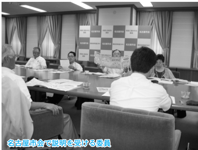
名古屋市会で説明を受ける委員

※詳しくは、14・15ページ「委員会での 主な質疑」総務文教常任委員会、都 市建設常任委員会欄をご覧ください。