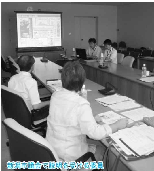
新潟市議会で説明を受ける委員

都市建設常任委員会では、8月 25日・26日の2日間にわたり行政 視察を行いました。8月25日には、 新潟県長岡市で、21世紀の市民協 働型シティーホールの整備など、 「長岡市中心市街地地区都市再生 整備事業について」を視察し、翌 26日には、新潟県新潟市で、施設 整備を、効率的・効果的に行うG ISを活用した施設配置のための 「アセットマネジメント及びファ シリテイマネジメントについて」 を視察し、各市の担当者の説明を 受け、質疑を行い、先進事例の研 究を行いました。