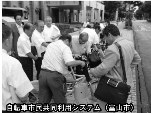
自転車市民共同利用システム (富山市)