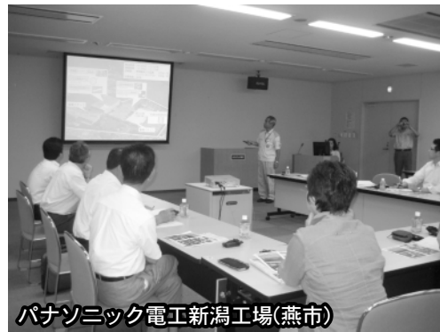
パナソニック電工新潟工場(燕市)