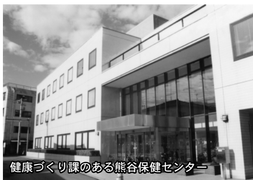
健康づくり課のある熊谷保健センター

「クレジットカードでの収納について」「教科書バリアフリー化について」「公共施設に杖専用ホルダーの設置について」