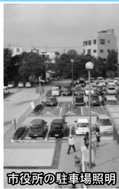
市役所の駐車場照明