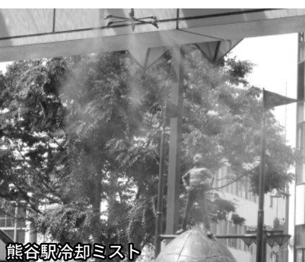
熊谷駅冷却ミスト

的な取組を定めており、この中でLED照明などの照明器具のほか、事務用品やOA機器、電気製品などの物品は、環境に配慮した細かな基準を定めており、現在は、これにより物品調達を行っている。②市内には、壁面緑化を実施している施設や遮熱塗装を行った道路、また、熊谷駅には冷却ミストを設置するなど、温暖化対策や環境に配慮した施設や設備がある。こうした施設などを、見えるかたちで情報発信することは、環境に対する市の認知度を高めるうえで、重要であると考えている。人の流れによりこれらをつなぐ仮称「環境モデルエリア」の設定については、今後、民間企業などとの協働等による実施も含めて研究していきたい。(環境政策課)