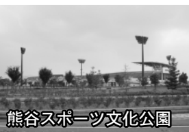
熊谷スポーツ文化公園

（保健体育課） ○その他の質問項目 「大原地域の水害対策について（Part2）」 「教育問題」