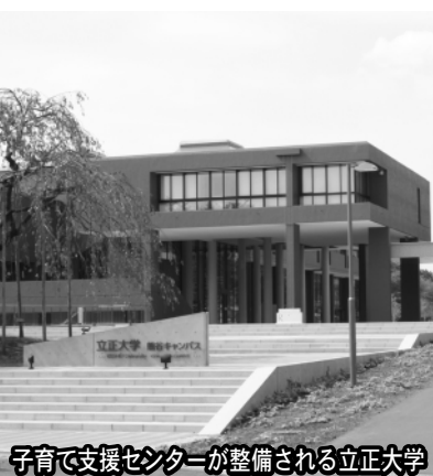
子育て支援センターが整備される立正大学

答 1,099万8,000円のうち、立正大学の改修工事費補助として、1,000万円。残りの99万8,000円は、奈良保育園の備品購入等の事業である。立正大学の子育て支援センターの規模としては、約200平方メートルの部屋を改修し、支援拠点として整備すると大学側から伺っている。(所管課・こども課)