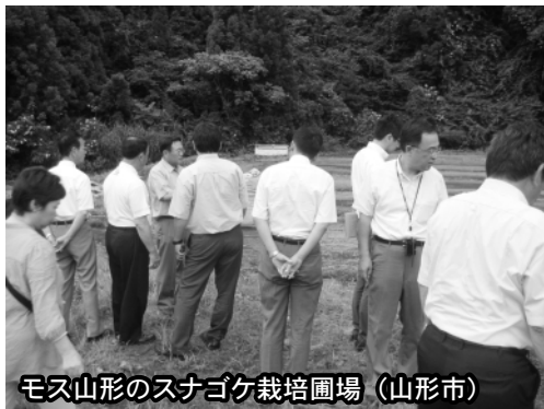
モス山形のスナゴケ栽培圃場 (山形市)

富山市では、「公共交通の 活性化について」「富山市自 転車市民共同利用システムに ついて」の視察を行い、担当 者から「富山市では、LRT 等の導入により公共交通を活 性化させ、コンパクトなまち づくりを目指している。また、 自転車市民共同利用システム 事業を、本年3月20日から開始 従来のレンタサイクルとの違 いは、全国初の民間事業者の 広告収入による施設整備、運 営である。」という説明を受 けました。一方、金沢市では、 「新金沢交通戦略について」「金 沢バスターリガー方式について」 の視察を行い、担当者から「金 沢市の『新金沢交通戦略』と しては、歩行者・公共交通優 先のまちづくりを進め、まち の魅力を引き出す取り組みを している。金沢大学の郊外移 転がきっかけとなったバスター リガー協定は、一つの好事例 となっている。」という担当 者からの説明を受けました。