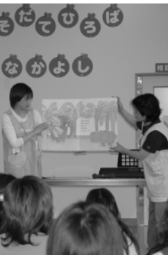
「荒川、利根川堤防の除草について」