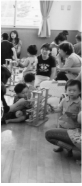
(審査状況・継続審査)

◇国に対して後期高齢者医療制度の廃止を求める意見書の提出を求める請願 (審査結果・不採択)