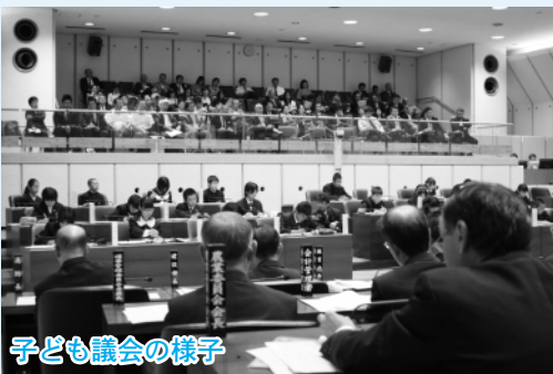
子ども議会の様子

昨年10月15日に市議会本会議場において、「子ども議会」が開催されました。 会議では市内16の中学校から選出された32名の子ども議員から熱中症対策や学校の耐震工事などについて、子どもたちの視点からとらえた質問がなされ、市長をはじめ、副市長、教育長、担当部長が答弁を行いました。