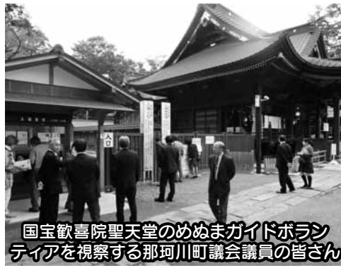
国宝歎喜院聖天堂のめぬまガイドボラン ティアを視察する那珂川町議会議員の皆さん