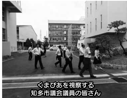
くまびあを視察する 知多市議会議員の皆さん