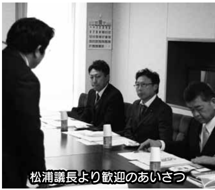
松浦議長より歓迎のあいさつ

11月5日 山梨県甲府市議会こつふクラブⅡ子育てするなら熊谷市について、あつさはれば熊谷流について