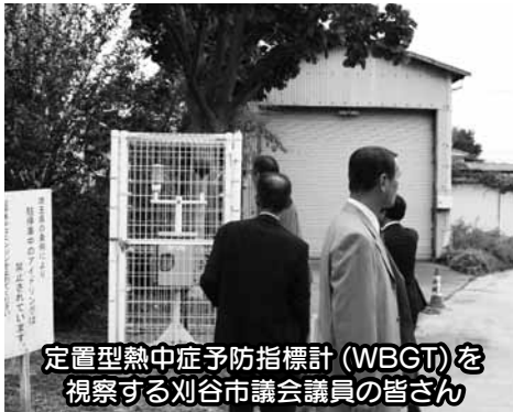
定置型熱中症予防指標計(WBGT)を 視察する刈谷市議会議員の皆さん