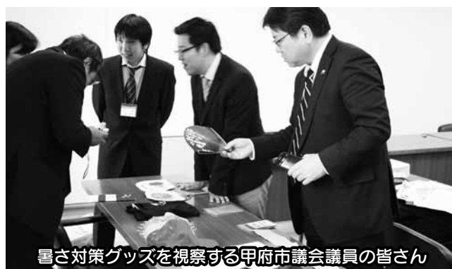
雪さ対策グッズを視察する甲府市議会議員の皆さん

11月5日 山梨県甲府市議会こつふクラブⅡ子育てするなら熊谷市について、あつさはれば熊谷流について