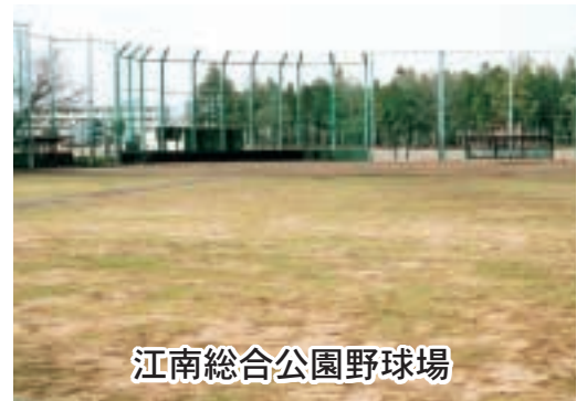
江南総合公園野球場

有料公園施設に江南総合公園野球場を加えるとともに、使用料について定めるものです。