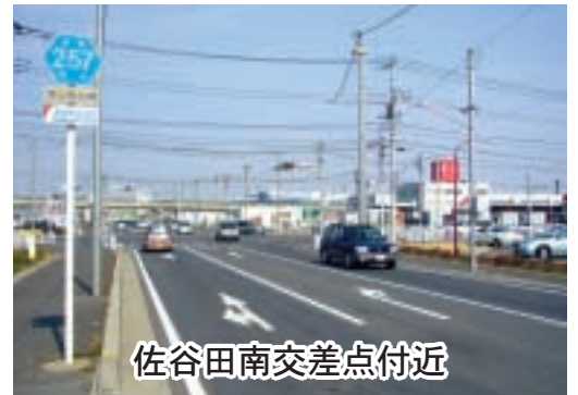
佐谷田南交差点付近

答 ①荒川大橋南の交差点については、慢性的な交通渋滞の解消と同交差点の安全対策として、右折帯及び右折信号の設置を埼玉県等に要望している。右折帯の設置には橋りょう本体の恒久的整備が課題となっており、右折信号の設置には至っていない。引き続き県の関係機関に早期実現を働きかけていく。また、