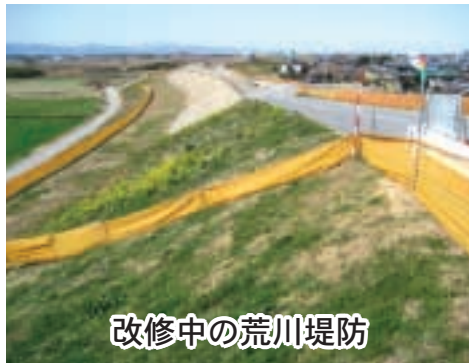
改修中の荒川堤防

答 所管する荒川上流河川事務所に確認したところ①左岸堤防では、久下橋から上流へ千二百メートルの荒川久下熊久築堤工事と下流へ千メートルの荒川久下上分築堤工事を、右岸堤防では通殿