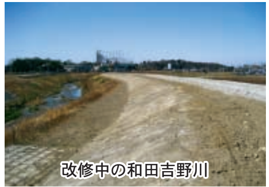
改修中の和田吉野川

答 和田吉野川の改修は、県が昭和四十一年度から事業着手し、玉作水門から和田川合流点までの三・八キロメートルが改修済みで、現在、和田川合流点から国道四〇七号の間で、和田吉野川は吉野橋までの約一・四キロメートル、和田川は和田橋までの約〇・五キロメートルを重点区間として整備を推進している。ご質問の件について事業主体の熊谷県土整備事務所に問い合わせたところ、①重点区間の早期整備を目指して来年度から測量・調査・設計を実施予定とのことである。②和田吉野川の和田川合流点から吉野橋までの区間に、河川改修に伴う橋の架け替えは五