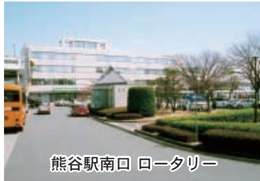
熊谷駅南口 ロータリー

いるため、防犯上の観点から植栽をある程度伐採できないか③ムクドリ対策について、それぞれ伺いたい。