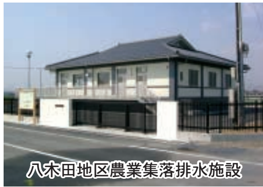
八木田地区農業集落排水施設

八木田地区農業集落排水施設の供用を開始するため、施設名称、処理区域、処理施設の位置等を定めるものです。