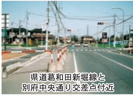
県道葛和田新堀線と別府中央通り交差点付近

県道葛和田新堀線と別府中央通り交差点先の未整備部分には、交差点の直前にバリケードが設置され、交通安全上、常に危険と背中合わせの状況にある。今日に至るまでの整備経過と今後の見通しについて伺いたい。