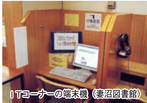
ITコーナーの端末機 (妻沼図書館)

○その他の質問項目 「公共工事で平成十八年度は一般競争入札の増加で落札率の変化はどうか」