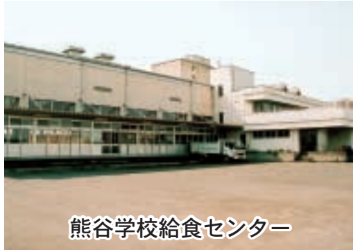
熊谷学校給食センター

リット等について検討を進めており、結論については今年の秋を目途にしている。厳しい社会経済状況の中、新たな施設の建設には多額の財政支出が必要になることなどから、慎重に今後の方向性を見いだしていきたいと考えている。 (熊谷学校給食センター)