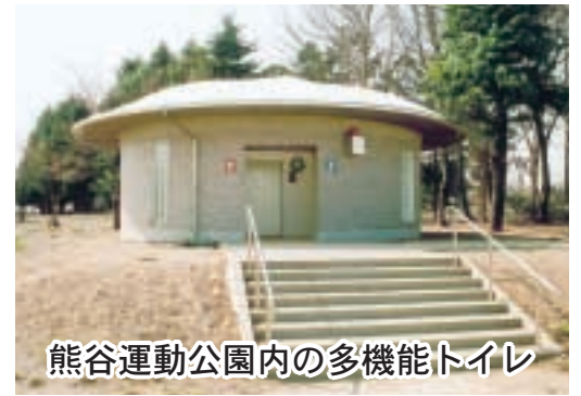
熊谷運動公園内の多機能トイレ

①これまで本市が設置した公園は、都市公園や農村公園等、市内に百十二カ所ある。そのうち熊谷運動公園、