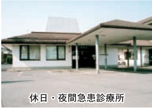
休日・夜間急患診療所

問 今、全国で病院や医師、特に小児科や産科が不足し社会問題化している。国や県でも子育て支援を挙げているが、子供の命が脅かされているのが現状である。本市でも人口十万人当たりの医師数は一五三人と少ない状況だが、①休日・夜間急患診療所の診療状況と時間外の体制は②救急隊の充実に大きな役割を持つ中央消防署は老朽化しており、建て替えが急務と考えるが、それぞれ伺いたい。