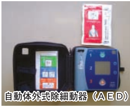
自動体外式除細動器 (AED)

今回の配備予定が市有施設であるため、研修は市職員を対象にしているが、今後、市民を対象とする講習会等について考えていきたい。(所管課・健康づくり課)