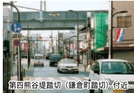
第四熊谷堤踏切（鎌倉町踏切）付近

答 「第四熊谷堤踏切」、通称「鎌倉町踏切」は、JR高崎線と秩父鉄道本線の二路線が並行し、上熊谷駅が近接するとともに国道十七号と荒川通線をつなぐ主要な踏切である。国土交通省の行った全国の踏切総点検結果の資料によると一日の平均交通量は自動車約三千九百台、自転車と歩行者が約二千九百人と、市内でも交通量が多い踏切である。踏切道の幅員は約十・三メートルで、延長は十九・三メートルである。路面はJR高崎線が木製の敷板で、秩父鉄道本線がコンクリート製の敷板で施工され、その間をアスファルト舗装で接続しており、凹凸が激しい状況である。踏切道の維持管理については、国の「道路と鉄