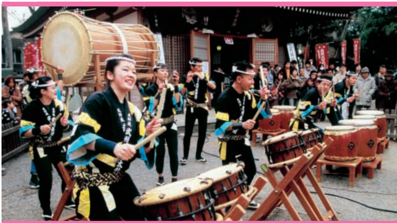
聖天山新春妻沼太鼓 (第1回熊谷市観光写真コンクール入賞作品)

問い合わせ 熊谷市議会事務局 〒360-8601 埼玉県熊谷市宮町二丁目47番地1 ☎048-524-1111(内線412~416) E-mail gikaijimukyoku@city.kumagaya.lg.jp http://www.city.kumagaya.lg.jp/shigikai/