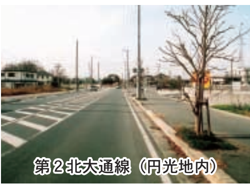
第2北大通線 (円光地内)

地買収等の進捗状況を勘案しながら事業に着手していく。また、第二北大通線の整備とともに幹線第一号線を国道四〇七号まで延伸することを新市建設計画に位置付けた。これら幹線道路が開通すると熊谷警察署前交差点周辺の渋滞解消が図られると考えている。(都市計画課) ○その他の質問項目 「健康福祉のまちづくり、スポーツ熱中宣言都市推進について」