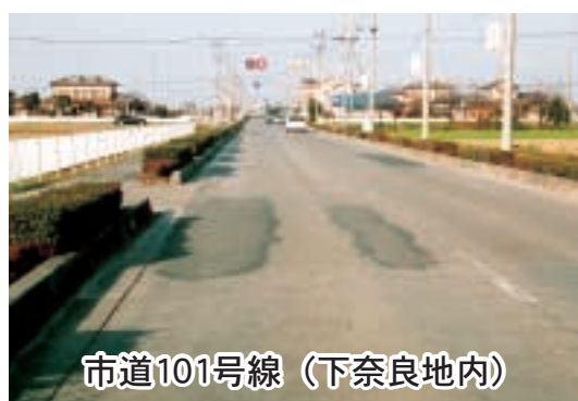
市道101号線(下奈良地内)