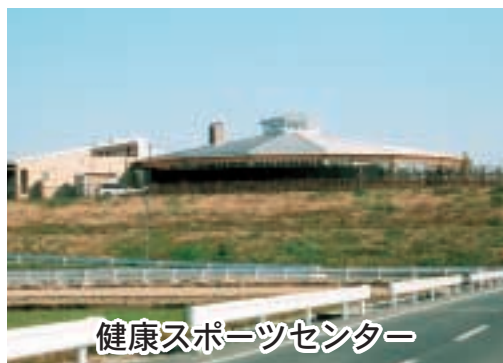
健康スポーツセンター

額は③市内循環バス「ひまわり号」の乗り入れによる利用者数の増減はあったのか④今後赤字を減らすためにどのような利用促進対策を考えているのか、それぞれ伺いたい。