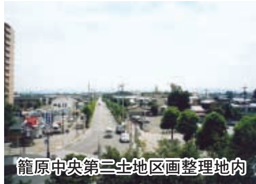
籠原中央第二土地区画整理地内