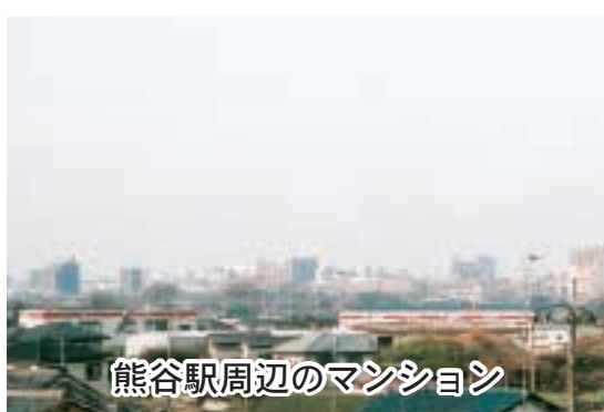
熊谷駅周辺のマンション

答 ①区分所有の建物、いわゆるマンションは平成十八年十月現在六十二棟、三千二百七十六戸である。②家賃の不払いについての相談はあるが、建替え等に関する相談は受けていない。③本市では、マンションの建替えの円滑化等に関する法律の担当課は都市計画課、建替えに関する技術的支援については開発指導課と定めている。また、