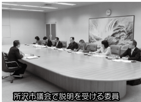
所沢市議会で説明を受ける委員

また、27日には埼玉県所沢市、埼玉県ふじみ野市で、「決算特別委員会」について、各市議会の議員及び担当者から委員会の進め方や決算審査の流れ等についての説明を受け、質疑を行いました。先進事例の研究を行いました。