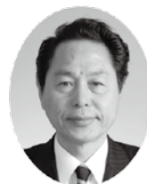
みづらかずいち 三浦和一議員 (公明党)