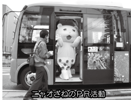
ニャオざねのPR活動

年生にチラシと時刻表、本市転入者に時刻表と路線図の配布などを行っている。さらに、ニャオざねが直実号に乗りして熊谷駅や星川周辺で実施するPR活動のお知らせを保育所、幼稚園に配布するなど、小さな子どもを持つ親への利用を呼びかけている。④ほたる号、直実号ともに乗車客数は徐々に増加しているが、直実号は目標の5割程度となっている。このため、平成25年4月から時刻表を改正し、更なる乗車客数の増加を目指している。今後、市民のみなさんに利用されるゆうゆうバスとなるよう、利用促進に向けた取り組みを進める。