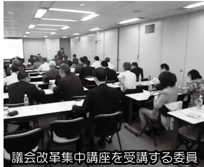
議会改革集中講座を受講する委員

議会改革特別委員会では、3月23日と27日の2日間、行政視察を行いました。23日には、東京都中央区で開催された議会改革集中講座in東京「政務活動費の使途基準の在り方」についての講座に参加し、政務活動費の使途基準の参考と義を拝聴してきました。