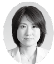
はやし さちこ 議員 (公明党)

問 年々増加する児童虐待を防止するために、全国的に注目されている取組みとして「ホームスタート」事業がある。未就学児が一人でもいる家庭に、研修を受けたボランティアが週に一度、二時間程度、定期的に約二〜三ヶ月間訪問し、滞在中は友人のように寄り添いながら「傾聴」や「協働」等の活動をする。熊谷市においても、このような「家庭訪問型子育て支援」を導入すべきと考えながら、ホームスタートの推進について、伺いたい。