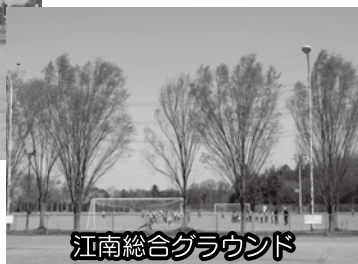
江南総合グラウンド