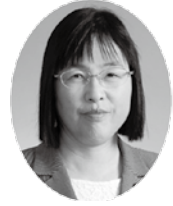
さくらい くるみ 議員 (日本共産党)

問 所得の1割を超える保険税が暮らしを圧迫している。低所得者への減免の拡充を求め、①国保加入世帯中、所得100万円以下の割合②滞納世帯数とそのうち、所得100万円以下の割合③差押えの件数と金額④条例で認められている「所得が皆無または著しく減少した世帯」への減免実績がないが、具体的な規程をつくるべき⑤病院窓口での一部負担金の減免について、それぞれ伺いたい。