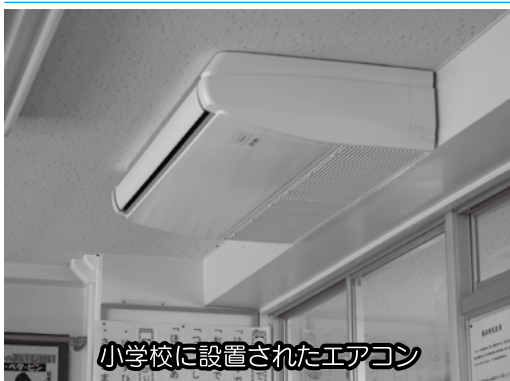
小学校に設置されたエアコン

①概ね12月上旬から3月中旬までである。②学習環境として望ましい室温とされる、18度から20度になるように設定している。ストーブ、エアコンそれぞれの使用