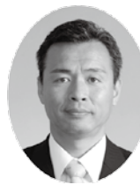
もりやあつし 守屋淳議員 (公明党)