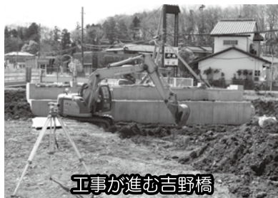
工事が進む吉野橋

とを懸念して、狭窄部を設け、流出抑制を図り、下流部の流量負担を軽減する目的で、眼鏡橋等が設置されたものである。そのため、河川改修が完了すると眼鏡橋等は不要となる。今後は、改修状況を踏まえつつ、眼鏡橋等狭窄部の取り扱いについて、県と調整を図っていきたい。（河川課） ○その他の質問項目 「各種審議会について」