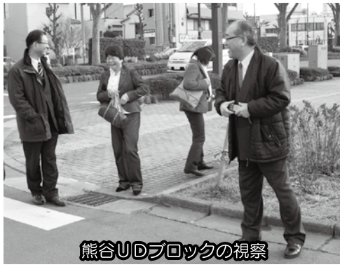
熊谷UDブロックの視察