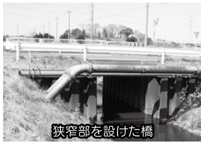
狭窄部を設けた橋

答 ①和田吉野川を管理している埼玉県熊谷県土整備事務所に確認したところ、現在国道407号吉野橋の架替工事を進めており、平成25年度中の完成を目指して施工中のことである。今後は、廃川となる区間の整備等に関する地元説明会を実施し、吉野橋上流部分の未整備区間の河道改修や、橋の架替に向けた調査設計を行う等、引き続き改修事業を進めていきたいとのことである。②眼鏡橋等は、上流部になる江南地区の土地改良事業に合わせ、河川改修が行われ設置されたものである。当時は、下流の整備がされていなかったため、下流地域の氾濫被害が拡大するこ