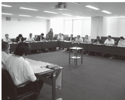
犬山市議会での視察の様子

今後は、委員会等で、議論の多角化や深度化がなされるよう議員間の自由討議を実施していく予定である。」という説明を受けました。