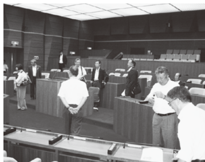
可児市議会での視察の様子

翌3日の岐阜県可児市議会では、「全ての会議のインターネット中継、議員活動の公表、議会報告会の開催、意見交換会の開催など、議会改革に取り組む、各議員の議案に対する賛否についても、ホームページ及び議会情報で、全会一致以外について公表している。議会改革のための市民アンケート調査等も実施した。