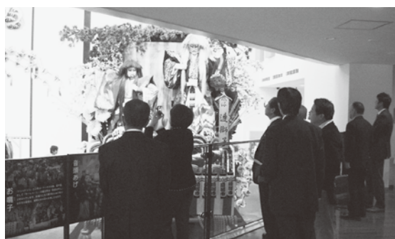
盛岡市での視察の様子