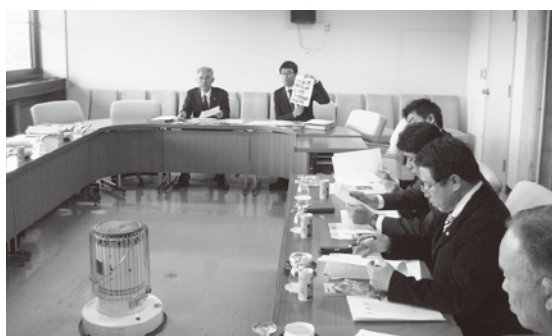
弘前市での視察の様子