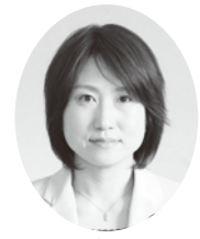
議員 林 幸子 はやし さちこ (公明党)