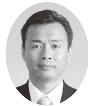
もりや あつし 議員 守屋淳 (公明党)