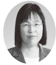
桜井 くるみ 議員 (日本共産党)