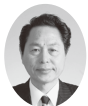
みうらかずいち 三浦和一議員 (公明党)