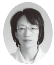
議員 関口 弥生 せきぐち やよい (公明党)