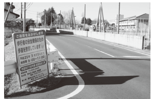
改良工事中の市道90198号線

答 ①この事業は、大里から江南を結ぶ、延長約6キロメートル、幅員15メートルの荒川右岸の広域幹線道路。平成20年度に、旧県道玉川熊谷線から旧東松山有料道路を結ぶ延長約250メートルの市施工区間の測量及び設計等を実施したが、全体区間の線形決定と、事業主体となる埼玉県が西環状線の事業中であり、新規路線着手の見通しが立っていないため、現在事業が停止している。②市道90198号線は、平成22年度から工事着手し、旧東松山有料