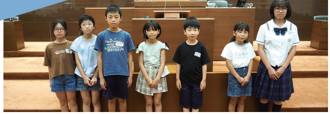
議場の演壇前で記念撮影

8月2日に、熊谷市子どもセンター事業のわくわく探検隊（市議会探検隊）を実施しました。