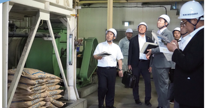
第一水光園で職員の説明を受ける様子

5月17日、初当選議員の研修として、水道庁舎、くまびあ、消防本部、各行政センター等の市有施設を視察しました。