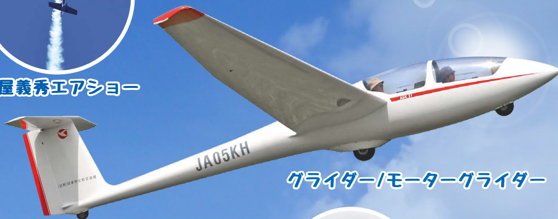
グライダー/モーターグライダー