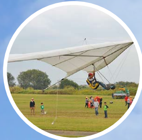
ハンググライダー