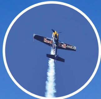
室屋義秀エアショー