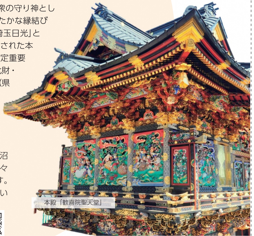
本殿「歡喜院聖天堂」