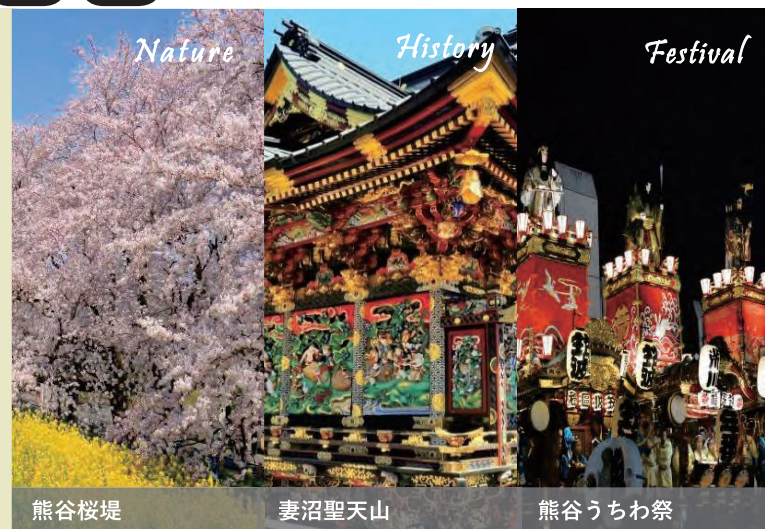
熊谷桜堤 妻沼聖天山 熊谷うちわ祭

祭り ~Festival~ 関東一の祇園「熊谷うちわ祭」、県内最大級の規模を誇る「熊谷花火大会」など、暑いまちにふさわしい熱い祭りやイベントが、訪れた人を熱狂させます。