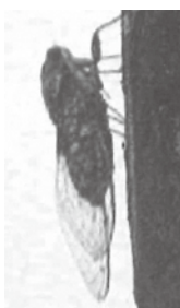
よこ すがた 横からの姿