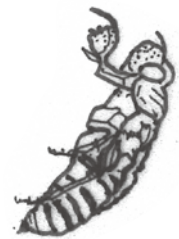
だっぴご 脱皮後のぬけがら