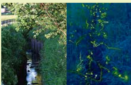
ゲンジボタル生息地 (熊谷市千代ほか)

川沿いに桜が林立する桜の名所。園内には大きなローラーすべり台などの遊具、ジャブジャブ池、バーベキュー広場等がある。