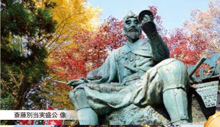
斎藤別当実盛公像