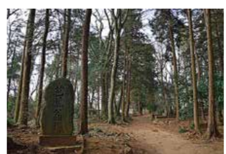
本堂裏の林と参道

その二月～三月を中心に、学業成就を願う若者や新たな門出の幸せを求める参拝者が関東一円から数多く訪れ、また本堂の前には参拝者の願いが込められた夥しい数の絵馬・千羽鶴・寄せ書きなどが並び、広く心の拠り所とされ深い信仰を寄せられていることが伺える。