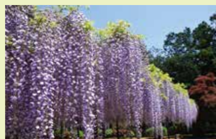
江南の藤 (熊谷市板井1625-8)

比企丘陵北端に位置する古墳群は、前方後方墳2基・方墳26基・円墳8基があり、4世紀中葉～後半の土器などが出土している。ぎわめて密集しており、また保存状態も良く北武蔵地方の中でも貴重な古墳群。