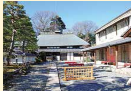
長島記念館 (熊谷市小八林1022)

県道257号線が荒川を渡る久下橋は、北側から大里方面に向かうと富士山が真正面に見え、その優美な風景は「関東の富士見100景」に選定されている。特に冬場の晴れた日は白い雪に覆われた姿が美しい。