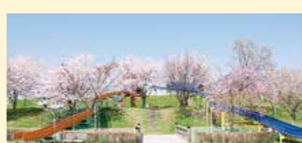
桜リバーサイドパーク (熊谷市相上1812)

川沿いに桜が林立する桜の名所。園内には大きなローラーすべり台などの遊具、ジャブジャブ池、バーベキュー広場等がある。