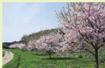
小江川1,000本桜 (熊谷市小江川)

平山家は村内で名主役を務めた旧家。古民家の特色をよく表した住宅は江戸時代中期の築で関東有数の農家住宅として国指定重要文化財に。外観は入母屋造りで茅葺きの大屋根は重厚。現在はイベント時に活用。