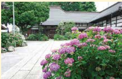
保安寺のあじさい (熊谷市箕輪180)

慶長18年(1613)に開山の保安寺は大里のあじさい寺と呼ばれ5月下旬～6月上旬には80種・1,300本のあじさいが咲き誇る。境内には十三佛霊場の仏様が祀られ、時期にはあじさいに囲まれる。