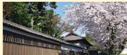
根岸家長屋門 (熊谷市青山152)

埼玉銀行頭取・会長を務め埼玉県経済界の発展に大きく貢献した故・長島恭助氏の生家を利用して開設された記念館、母屋は築300年を超える。重厚な蔵を改造した展示室には、長島氏が収集した美術品を展示。