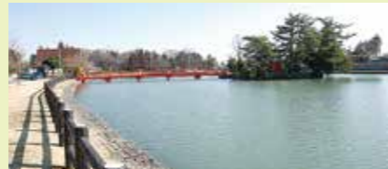
大沼公園 (熊谷市須賀広624-1)

秩父郡両神村(現・小鹿野町両神)から移植した推定樹齢140年のノダナガフジは300畳敷の大藤棚、枝張りの規模は県内最大級(35m×15m)で、保存団体は埼玉県生物多様性保全活動団体に登録されている。