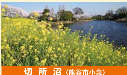
切所沼 (熊谷市小泉)

慶長18年(1613)に開山の保安寺は大里のあじさい寺と呼ばれ5月下旬～6月上旬には80種・1,300本のあじさいが咲き誇る。境内には十三佛霊場の仏様が祀られ、時期にはあじさいに囲まれる。