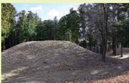
塩古墳群 (熊谷市塩)

小江川地区に10年かけて千本桜を植えるプロジェクトが進められており、里山の環境保護とともに桜の新名所が誕生。可憐な神代曙という品種が並び、それぞれの木には桜の里親が思いを込めて付けた名前のプレートが立つ。