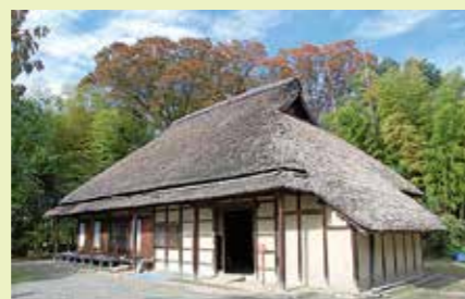
平山家住宅 (熊谷市榎春1067)

毎年5月下旬頃に、千代地区の川沿いや押切～榎春地区を流れる御正吉見堰幹線用水路など江南エリア各所の水の綺麗な場所でゲンジボタルが自然発生。エメラルドグリーンの光を放ちながら舞う様子は幻想的。