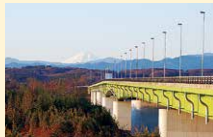
久下橋から望む富士山 (熊谷市嵐戸)

久下橋南詰から約500m西の切所沼は昭和13年の台風で荒川堤防が決壊した際に出来た沼で、ヘラブナ釣りを楽しむ人が多数訪れる。桜の時期にはソメイヨシノのピンクと土手の菜の花が水面に映り美しい。