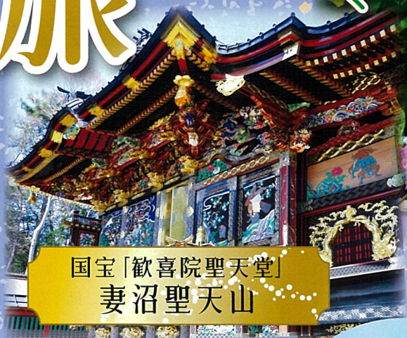
国宝「歓喜院聖天堂」 妻沼聖天山