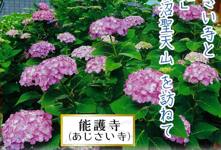
能護寺 (あじさい寺)