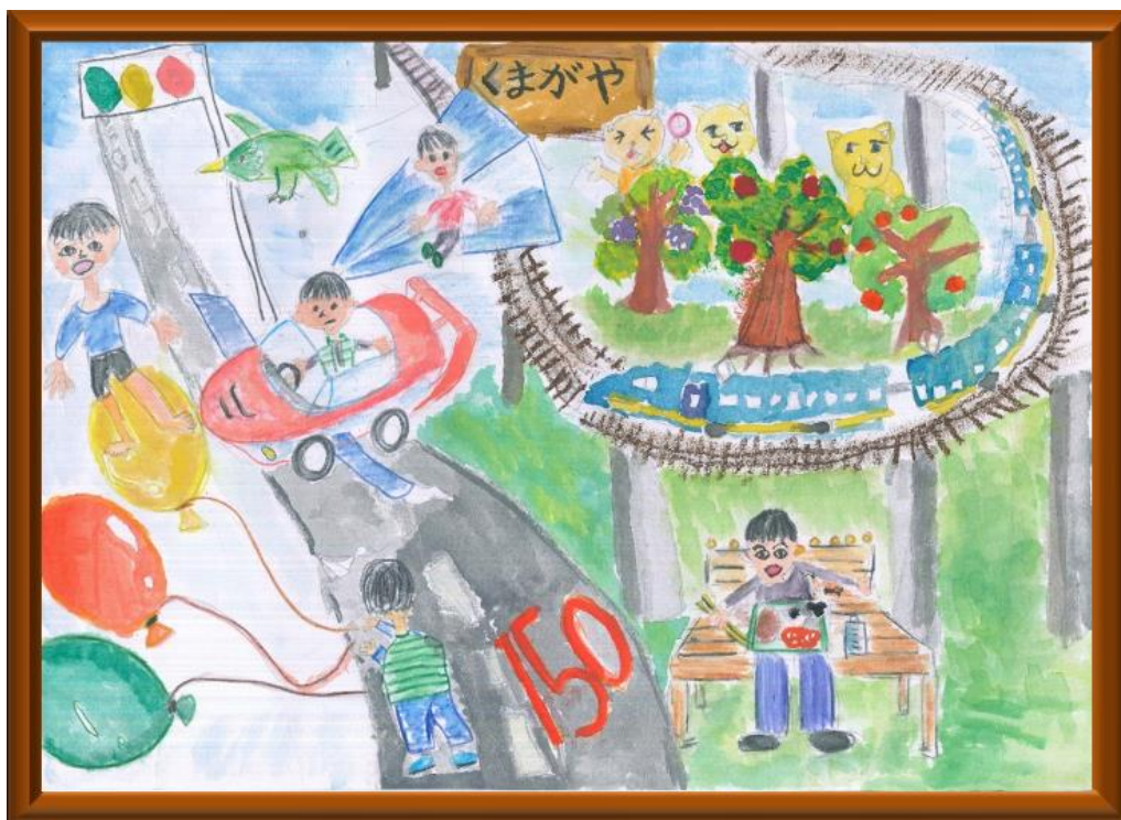
妻沼小学校1年「ニャオガネとゆめのこうそくれっしゃ」