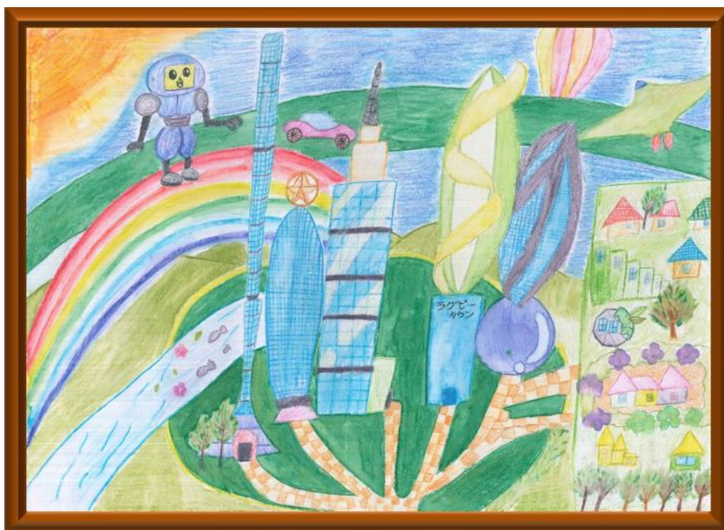
佐谷田小学校4年「にじ色タウン」