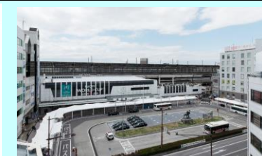
熊谷駅正面口駅前広場歩行者支援施設整備