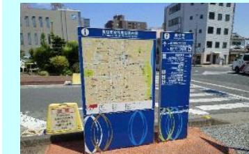
歩行者案内施設整備