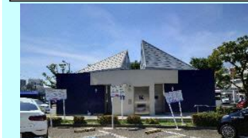
熊谷駅南口駅前広場公衆用トイレ 障害者誘導施設整備事業

まちの課題の変化 ・市民アンケート結果から、整備が進捗し満足度が向上したものの目標未達であることから、歩行者や自転車利用者が安心して利用できる道路空間の整備を継続して行う必要がある。 ・中心市街地地区内のバリアフリー整備や自転車通行環境整備が進み回遊性が向上した。今後は賑わいの創出に資する居心地の良い空間づくりを推進し、中心市街地地区の通行量を増やす必要がある。 ・都市再生整備計画以外の事業においても、まちづくりの課題解決に資する事業が実施され一定の効果を受けており、特に商店街を中心としたシティドレッシングや空き家・空き店舗に対する施策における官民連携の取組や、まちづくりを考えるワークショップの実施等を通じた市民協働がまちの課題の解決や再認識に重要であることなどを改めて認識した。