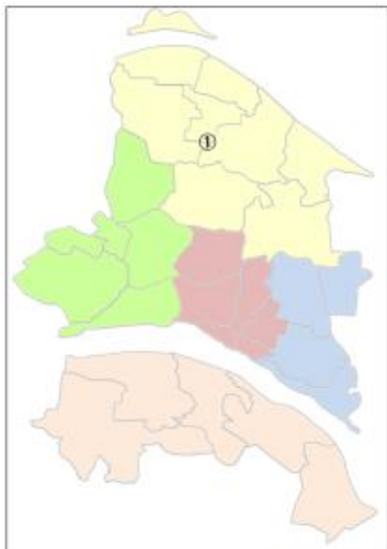
ウ 妻沼老人デイサービスセンター