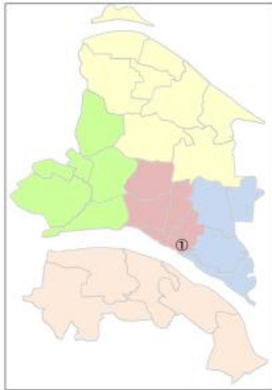
(2) パスポートセンター