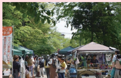
手づくり市の様子

りで幸せな時間を過ごせますように、 楽しみの種まきを続けていきたいです。 そして何より 嬉しいのは、 このコーナー に地域の方が 推薦してくだ さったこと です。 聖天様と地 域の方々に感 謝しながら笑 顔で話してく れました。