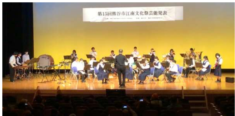
第15回熊谷市江南文化祭芸能発表