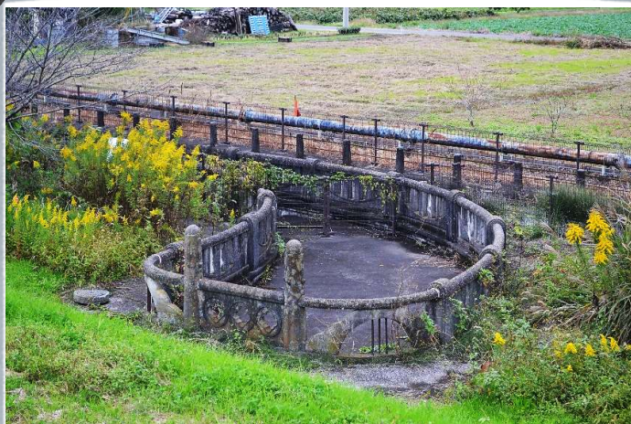
写真スポット 荒川左岸の呑口

10月25日(火)「江南サイフォン研究会」で調査報告と共に、柴田忠雄氏と山下祐樹氏の対談が開催された。