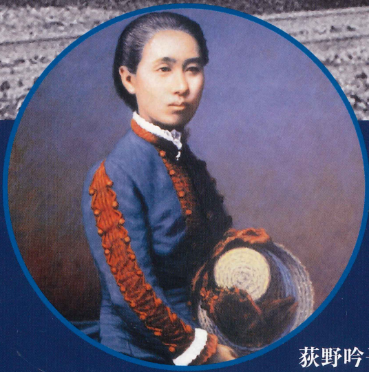
荻野吟子肖像（熊谷市蔵）