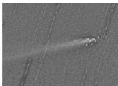
分裂するリニア彗星