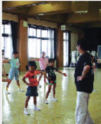
エアロビクスコース

対象 小学生 とき 6月10日(土)から毎週土曜日 夏休みを除く 10:00~11:30