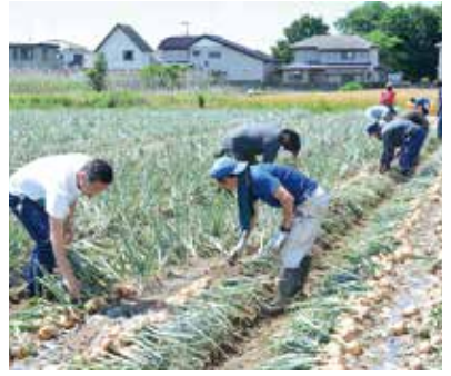
玉ねぎ収穫の様子

障害者の中には、施設に入るのではなく、働く機会がほしいという方が多くいます。また、ニートや引きこもりなど、様々な理由で社会の中に居場所がないと感じる方も、同じように働く場所を求めているケースがあります。人それぞれ様々な背景がありますが、自分ができることを与えられ、仕事をしながら暮らしていくことは、人生の豊かさにつながると信じています。今、「働きにくい人の雇用」という意味で使われる「ソーシャルファーム」という言葉がありますが、私はこれを「社会的健康」という言葉に置き換えて世界に発信してい