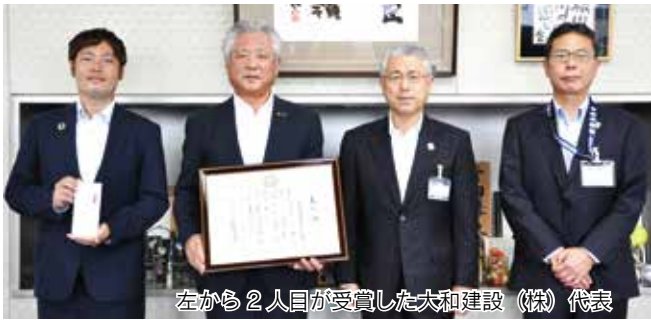
左から2人目が受賞した大和建设（株）代表