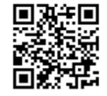
「食品衛生申請等システム」サイト