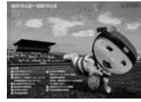
くらしのカレンダー

① 決められた日の お住まいの地区で、種類ごとにごみ出しの曜日は違います。くらしのカレンダーの曜日を見てください。