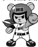
チーム公式キャラクター MB(エンビー)