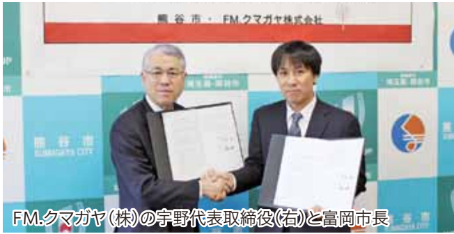
FM.クマガヤ(株)の宇野代表取締役(右)と富岡市長