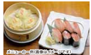
メニューの一例(画像はイメージです)