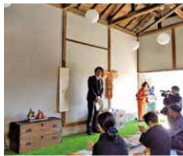
二十二夜でのイベントの様子

コミュニティスペースは、仲間の女性たちの協力もあってオープンしたこと、また利用者のターゲットを子育て世代の女性にしていたこともあって、如意輪観音の縁を感じ、店名を「二十二夜」としました。