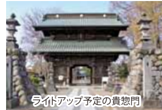
ライトアップ予定の貴惣門

がん検診の受診率の向上およびがんの早期発見・早期治療の啓発のため、ピンクリボン月間(10月)に妻沼聖天山をライトアップします。