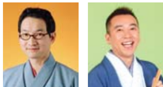
春風亭昇太 林家たい平

春風亭昇太・林家たい平二人会 Pコード<418-118> とき 7月16日(月・祝)16:00開演 料金 全席指定 S/3,500円 A/3,000円