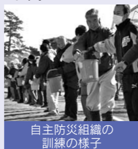
自主防災組織の訓練の様子

自主防災組織は、なぜ必要? 大規模な地震などが発生した場合、消防など公共機関の対応能力を超える状況に陥るおそれがあります。 このため、特に災害発生直後は、地域の皆さんが、お互いに協力し「自分たちの地域は自分たちで守る」ことが重要です。 市内では、4月現在、自治会を主体に177の自主防災組織が結成され、防災訓練や防災知識の普及活動などを行っています。