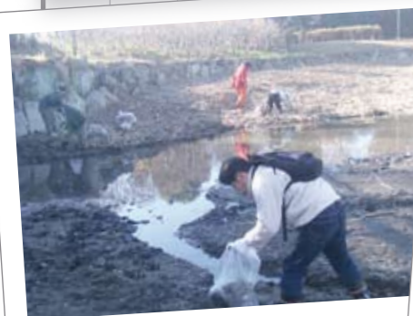
12月7日 別府沼公園ゴミゼロ活動

市内の商・工・農業が一堂に会した産業祭が、熊谷スポーツ文化公園で行われました。両日とも晴天に恵まれ、多くの人出で賑わいました。