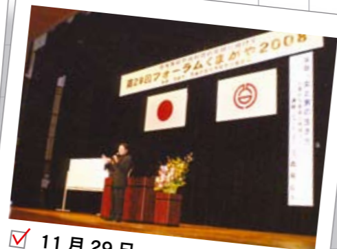
11月29日 第29回フォーラムくまがや2008

熊谷ふるさとの森づくりの会が主催し、夏の暑い熊谷に緑を増やすため、1,200人が参加し、熊谷運動公園多目的広場東側で、植樹祭が行われました。