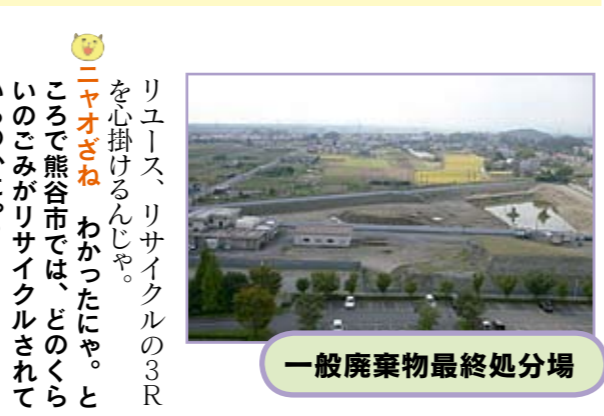
3 この状態でリサイクル業者へ

なるのにかや？。他の物はどうなるのにかや？ 博士 不燃ごみで鉄金属類は溶かして鉄にしているのじゃよ。また、資源物（紙類はダンボールや新聞紙、トイレットペーパーやティッシュペーパー等にリサイクルされているのじゃ。有害ごみである乾電池は鉄や亜鉛を抽出し、蛍光管は断熱材にそれぞれリサイクルされているのじゃ。 ニャオざね どうしてもリサイクルできない物はどうなるのにかや？ 博士 クリーンセンターへ運ばれたもので処分できずに残ったものは、寄居町にある彩の国資源循環工場に運ばれ再資源化され、スラグとして建設資材等に利用されるのじゃ。 ニャオざね 熊谷市にも一般廃棄物最終処分場があると聞いたのにかや？どこにあるのにかや？ 博士 熊谷文化創造館「さくらめい」との南側にあるんじゃないよ。収集したごみの中で、どうしてもリサイクルできないもの、例えば瀬戸物や植木鉢などを埋立処分する場所じゃよ。 ニャオざね 土に埋めるのにかや？ 博士 そうじゃよ。最近では全国的にみても、最終処分場の確保が難しくなっているんじゃないよ。最終処分場を長持ちさせるためにも、リデュース、