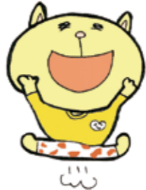
市民活動イメージキャラクター「ニャオざね」