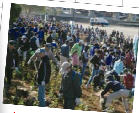
11月30日 あっぱれ!熊谷流 ふるさとの森づくり植樹祭

関東高等学校駅伝大会で4位に入賞し、全国高等学校駅伝競走大会への出場を市長に報告しました。なお、全国大会は12月21日に京都府で開催されました。