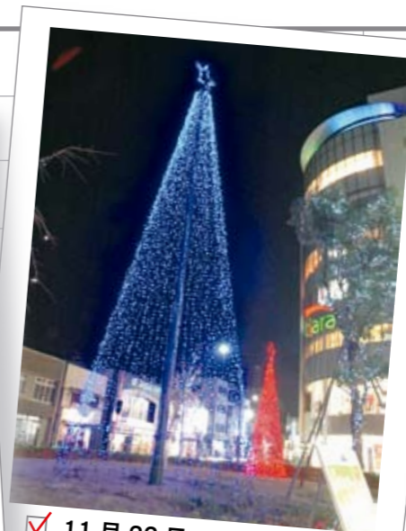
11月22日 熊谷駅東口ウインターイルミネーション2008

富士見中学校の生徒が、市民ボランティアであるフラワーキーパーさんの指導を受け、市役所通線や星川通線の歩道の花壇に、パンジーの苗を植えました。