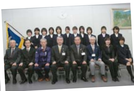
12月3日 県立熊谷女子高校陸上競技部が市長を表敬

関東高等学校駅伝大会で4位に入賞し、全国高等学校駅伝競走大会への出場を市長に報告しました。なお、全国大会は12月21日に京都府で開催されました。