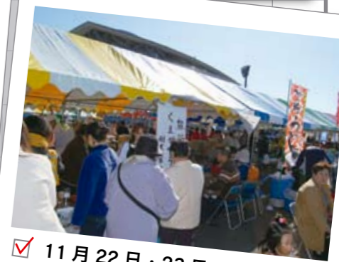
11月22日・23日 第4回熊谷市産業祭

熊谷駅東口(ティアラ口)にウインターイルミネーションが灯りました。1月31日まで毎夜、美しい輝きを楽しむことができます。