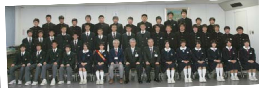
11月28日 新人体育大会埼玉県大会優勝・埼玉県駅伝競走大会優勝 市長表敬訪問

籠原駅南口で「かごはら光の散歩みち」の点灯式が開催され、美しいイルミネーションが灯りました。1月10日まで楽しむことができます。