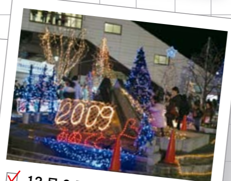
12月6日 第9回かごはら光の散歩みち

立正大学法学部・法制研究所主催で「地球社会と地域社会をつなぐもの」をテーマに開催されたシンポジウムに参加した市長は基調講演を行った大使と懇談を行いました。