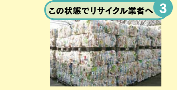
2 ペットボトルのプレス