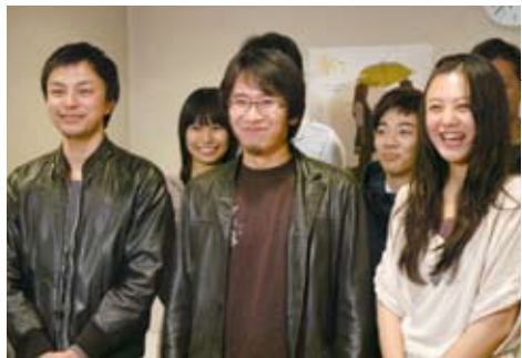
たか監督(中央)と映画「傘」出演者の皆さん

21歳、大学3年の正月に初日の出を見に行く車中、将来の話になりまして、うすうす役者をあきらめている自分がいました。美しい初日の出を写真に撮っていると、構図にこだわると、気が付きました。その時撮った写真は今でも気に入っています。一俺、才能