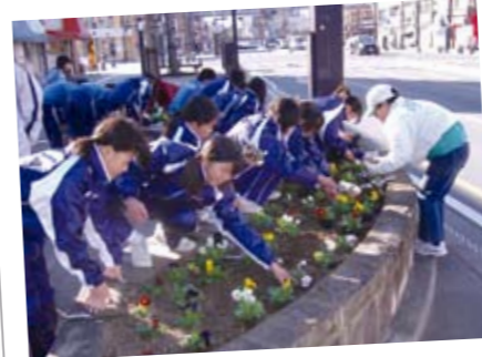
11月22日 植栽ボランティア活動