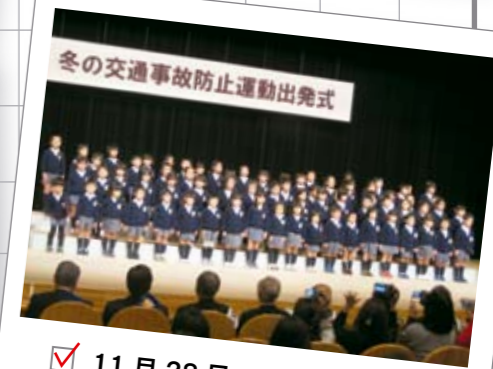
11月28日 冬の交通事故防止運動出発式

富士見中学校男子体操部と熊谷東中学校ラグビー部が、平成20年度埼玉県中学校新人体育大会兼第21回県民総合体育大会で優勝、また、埼玉県駅伝競走大会中学校の部で富士見中学校男子・熊谷東中学校女子が優勝し、市長に報告をしました。なお、駅伝は、山梨県で開催された関東大会、山口県で開催された全国大会に出場しました。