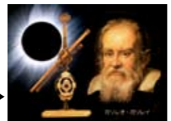
ガリレオの望遠鏡 と皆既日食