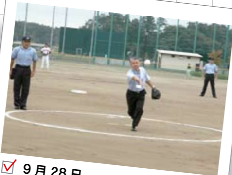
9月28日 江南総合公園グランドオープン記念試合 10月1日のグランドオープンに先立ち、市内ソフトボールトップリーグのチームによる記念試合が行われ、富岡市長が始球式を行いました。