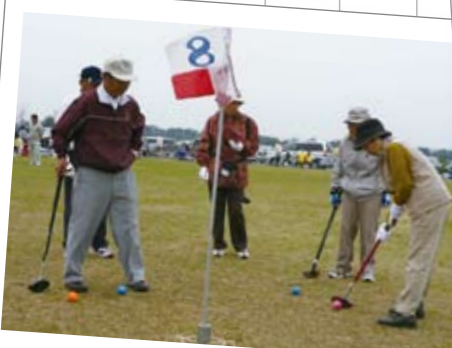
10月14日 世代間交流グラウンドゴルフ大会 荒川緑地運動広場で、高齢者の生きがいと健康づくり推進事業の一環として開催され、100チームが参加し、グラウンドゴルフの団体戦を行うとともに、仲間づくりの交流が行われました。