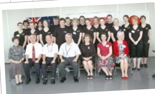
9月25日 ジェームスハーゲストカレッジが市長表敬 県立熊谷西高校と姉妹校提携をしているジェームスハーゲストカレッジ（インバーカーギル市）の生徒や関係者が、富岡市長を表敬訪問しました。