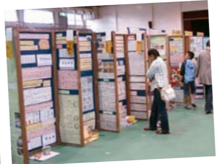
9月27日～29日 小・中学校科学振興展 市民体育館で、夏休みの自由研究など、市内小・中学生の科学研究作品約200点が展示されました。