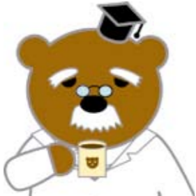
市民活動イメージキャラクター「ニャオざね」

博士 いやいや、ニャオざねにぜひ伝えておきたいのは、 これら指標は一番を争うようなものではない ということじや。たしかに、借金は少ないに越したことはない、黒字も多いほうがいいに決まっておる。しかし、市役所は、貯金が多いほどよいという訳ではないんじや。借金が、返せないほど多くなると、市民の方々に迷惑をおかけするのは、も