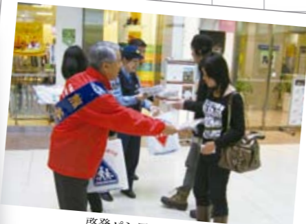
9月30日 「交通事故死ゼロを目指す日」の街頭キャンペーン 9月30日が新たに「交通事故死ゼロを目指す日」に定められ、熊谷駅コンコースで、交通安全意識の向上を目的にキャンペーンが行われました。