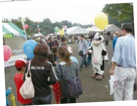
10月11日 彩の国 畜産フェア2008 埼玉県農林総合研究センター畜産研究所で、県内畜産物の試食・販売や、焼肉試食会、牛の乳しぼり体験など、畜産に関する楽しいイベントが開催され、多くの来場者で賑わいました。