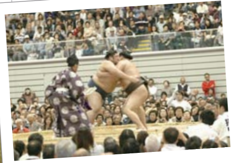
10月13日 大相撲熊谷場所 大相撲秋巡業が彩の国熊谷ドームで開催されました。当日は普段テレビでは見られない公開稽古や子どもたちへの稽古などもありました。土俵入りや取組では大勢の相撲ファンが力士たちに声援を送っていました。