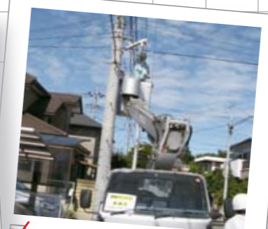
9月20日 防犯灯のボランティア清掃 「防犯のまちづくりに関する協定」に基づき、埼玉県電気工事工業組合熊谷支部の皆さんによる市内の防犯灯のボランティア清掃が行われました。