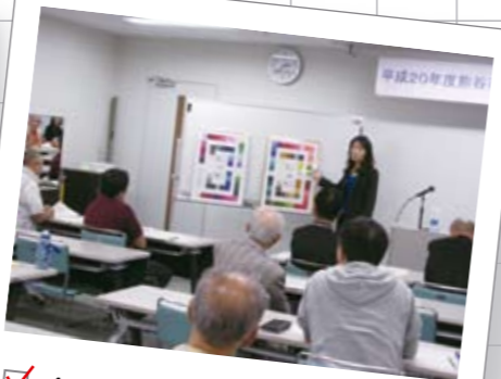
10月11日 男性セミナー 男女共同参画推進センター「ハートピア」で、「男は仕事」という固定的な性別役割分担意識を見直し「自分らしく」生きるための大切さを学ぶ一助となるよう「男性のためのカラーコーディネート講座」が開催されました。