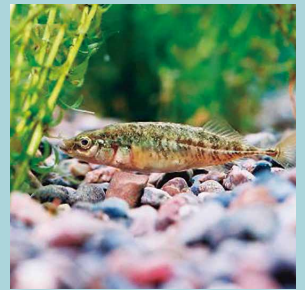
「市の魚」ムサシトミヨ

南北を流れる荒川と利根川は、水の恵みを与え、暮らしや産業の発展に深く関わっています。そのほか、市内を流れる元荒川には、絶滅危惧種に指定されている希少なムサシトミヨが生息しています。