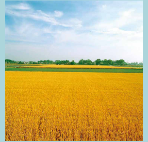
全国有数の小麦の生産地

肥沃な土壌と、充実した広域交通網などの産業立地優位性を生かし、農業、商業、工業の3つの分野がバランスよく発展しています。