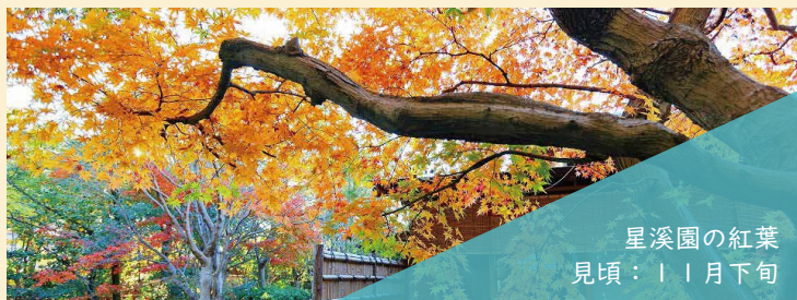
星溪園の紅葉 見頃：11月下旬