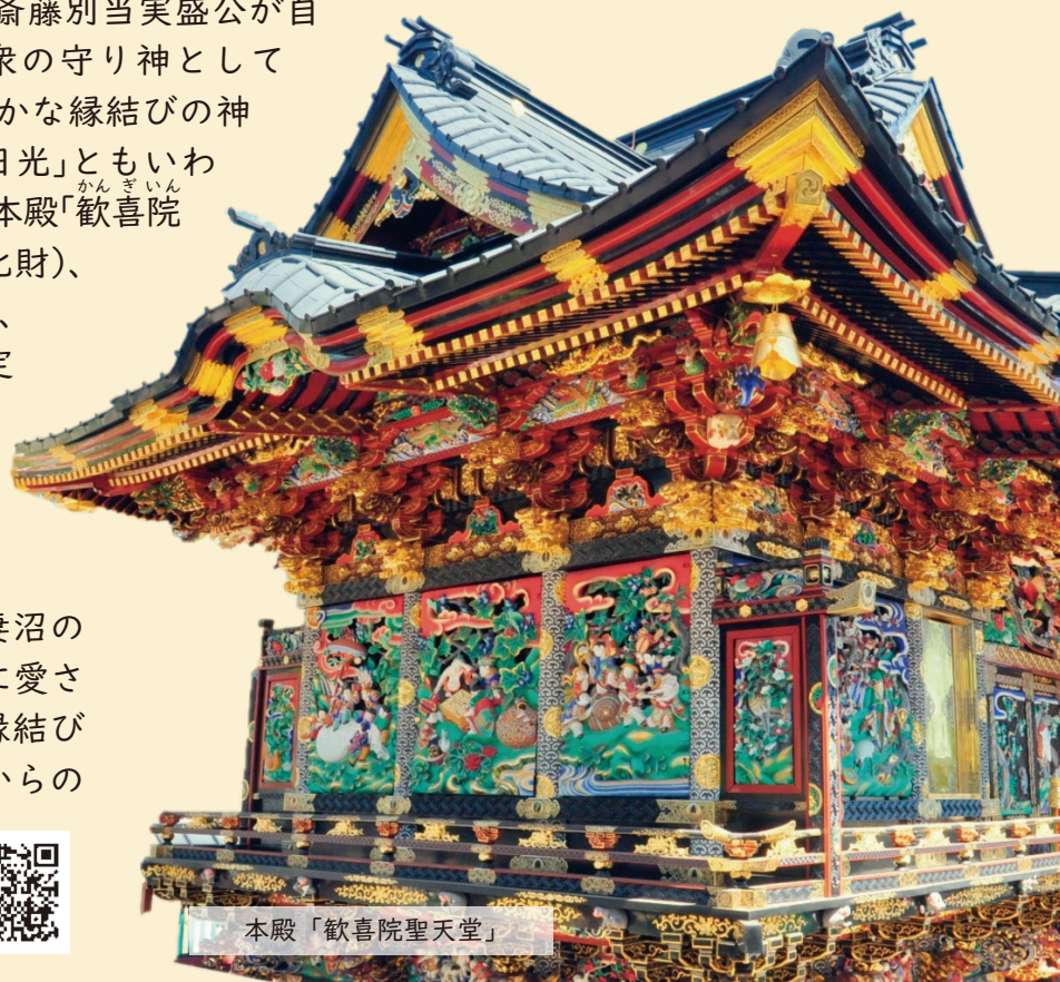
本殿「歡喜院聖天堂」