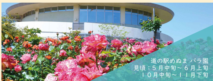
道の駅めぬまバラ園 見頃：5月中旬～6月上旬 10月中旬～11月下旬