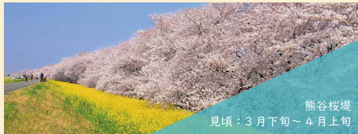
熊谷桜堤 見頃：3月下旬～4月上旬