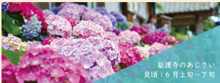
能護寺のあじさい 見頃：6月上旬～下旬