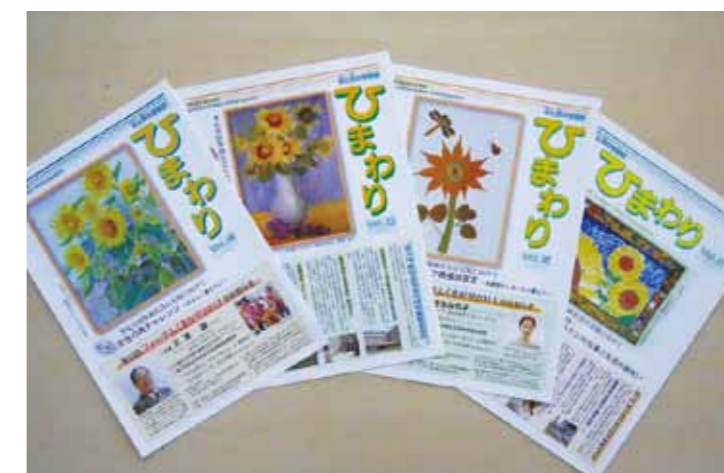
ひとひと 女と男の情報紙「ひまわり」