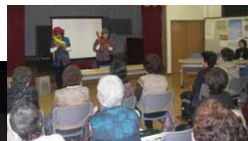
集会所での成人講座・防犯教室

このため、引き続き、学校・家庭・地域社会を通じて、広く市民に人権尊重の精神を培う人権教育、人権啓発を総合的に推進するとともに、市民一人ひとりの努力によって人権尊重の意識を高め、人が人として互いに尊びあい、すべての人々の人権が保障される、明るく住みよい地域社会を実現する必要があります。