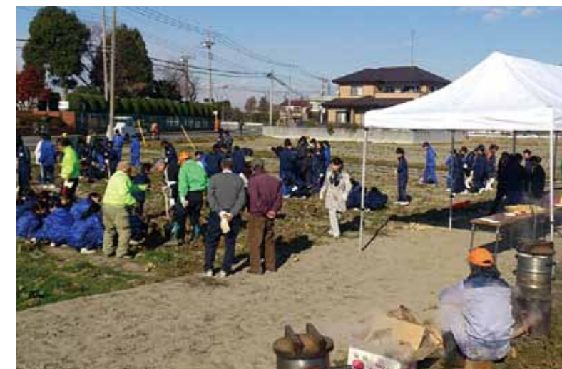
地域づくり応援事業 大幡小学校区連絡会による「農業体験」事業