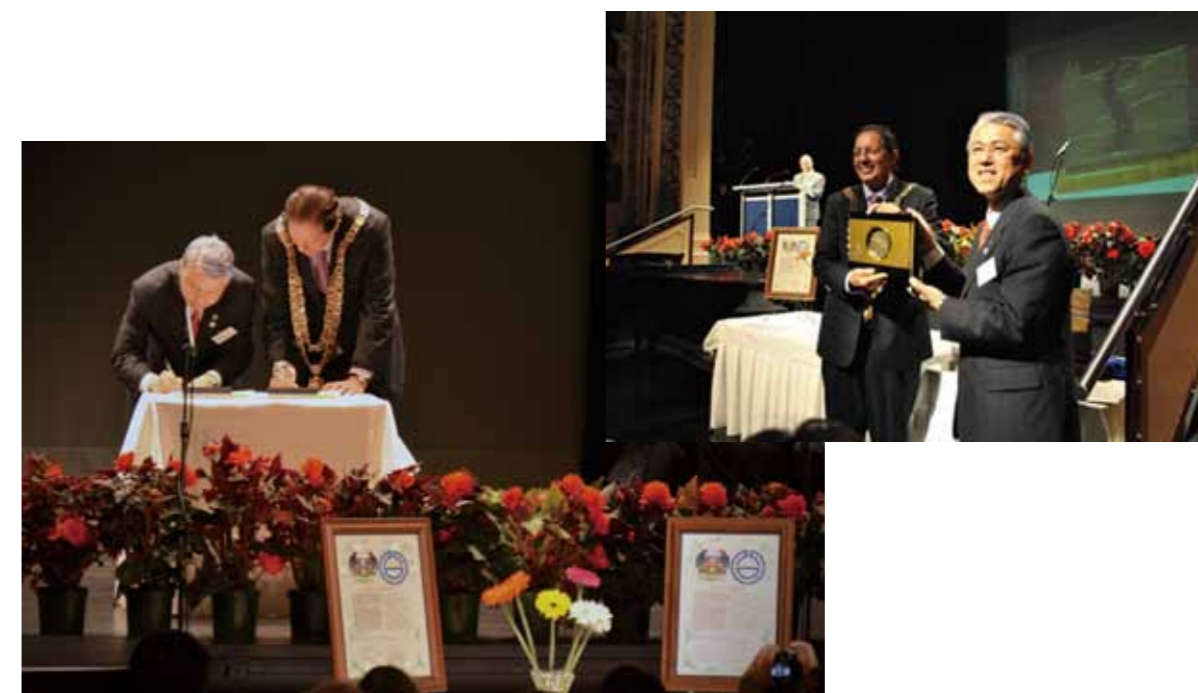
インパーカーギル市との姉妹都市提携20周年記念調印式