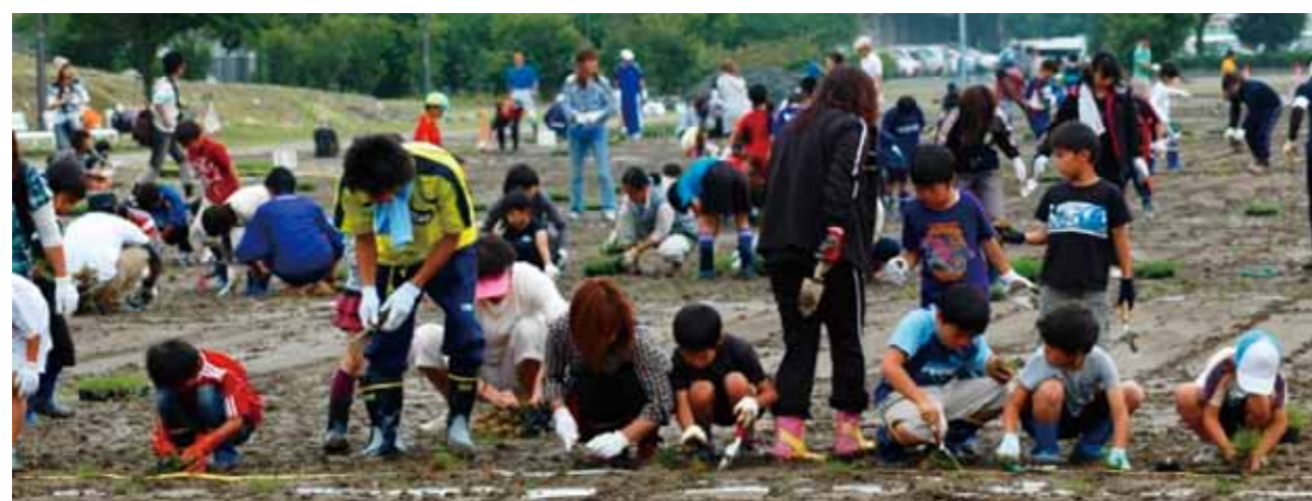
市民協働「熊谷の力」熊谷式運動場等芝生化事業

「市民にできること(自助)」、「地域にできること(共助)」、「行政が行うこと(公助)」は何かがあるかを再確認した上で、それぞれがその役割を果たすという原点に立ち返り、市民と行政が力を合わせ、協働のまちづくりを進めていくことが求められています。