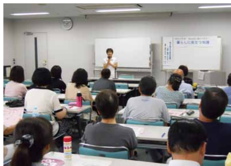
ひとひと 女と男のセミナー

しかしながら、 性別による固定的な役割分担意識 注3 の払拭、各種団体の役員等への女性の登用、ワーク・ライフ・バランス（仕事と生活の調和）の実現などにおいて依然として課題が残っており、さらに市民や事業者と連携して取り組む必要があります。