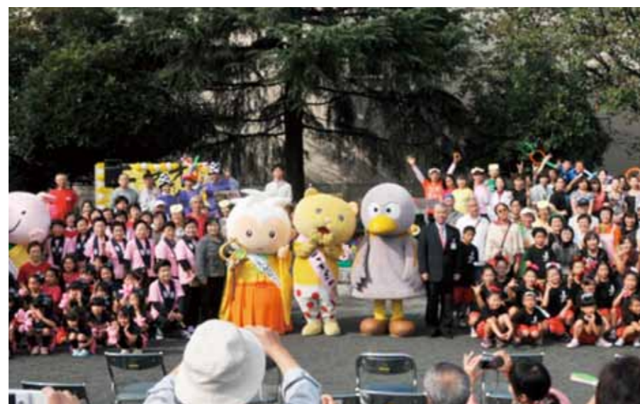
ニャオざねまつり