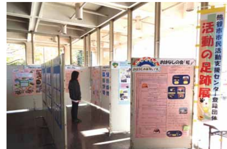
市民活動支援センター登録団体「活動の足跡展」